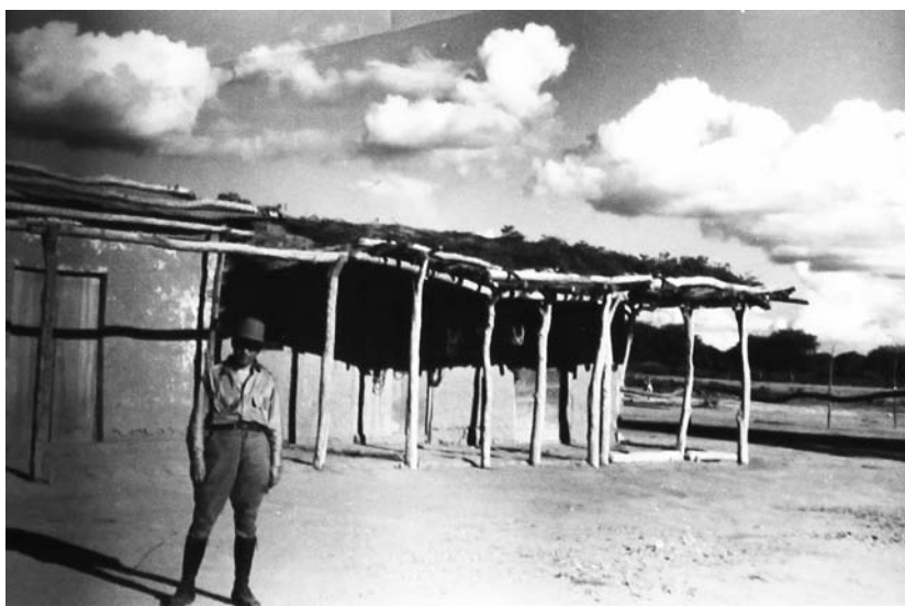
Figura 4. «Alfredo delante de un rancho», 1939