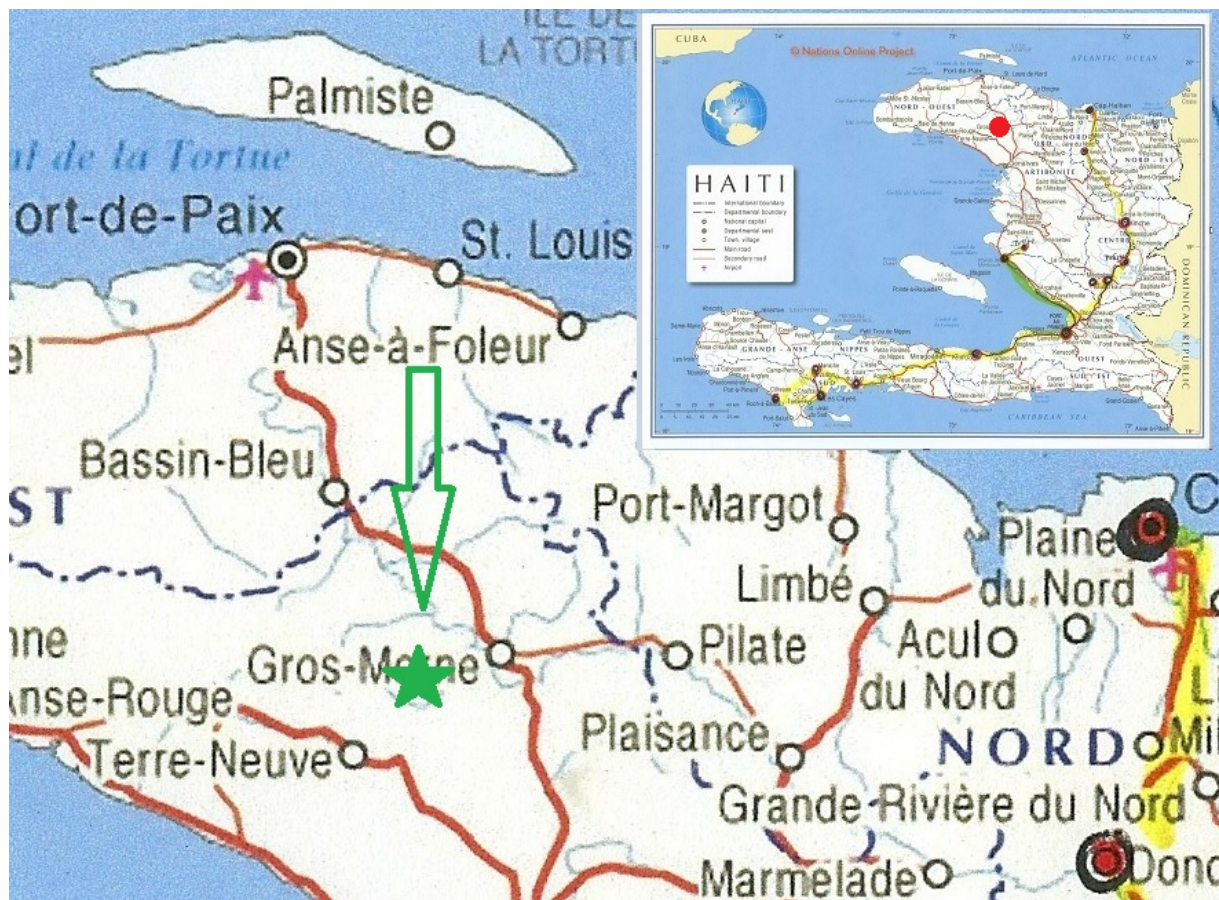
Figure 1. Localisation de la région concernée en Haïti

De par ses aspects socio-culturels, techniques, économiques, environnementaux et sanitaires, ce travail fait appel au développement de méthodes et à la mise en œuvre de différents outils et matériels. Nous allons décrire ce qui a été déployé à ce jour.