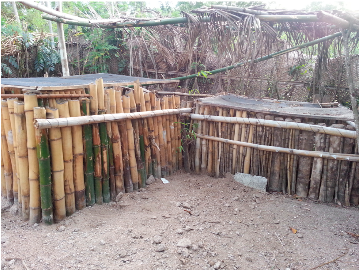
Figure 3. Le site de traitement des résidus solides

Après lavage et désinfection des seaux, l'eau s'écoule jusqu'à une zone d'infiltration située à quelques mètres plantée de plusieurs espèces végétales destinées à l'épurer avant infiltration dans le sol.