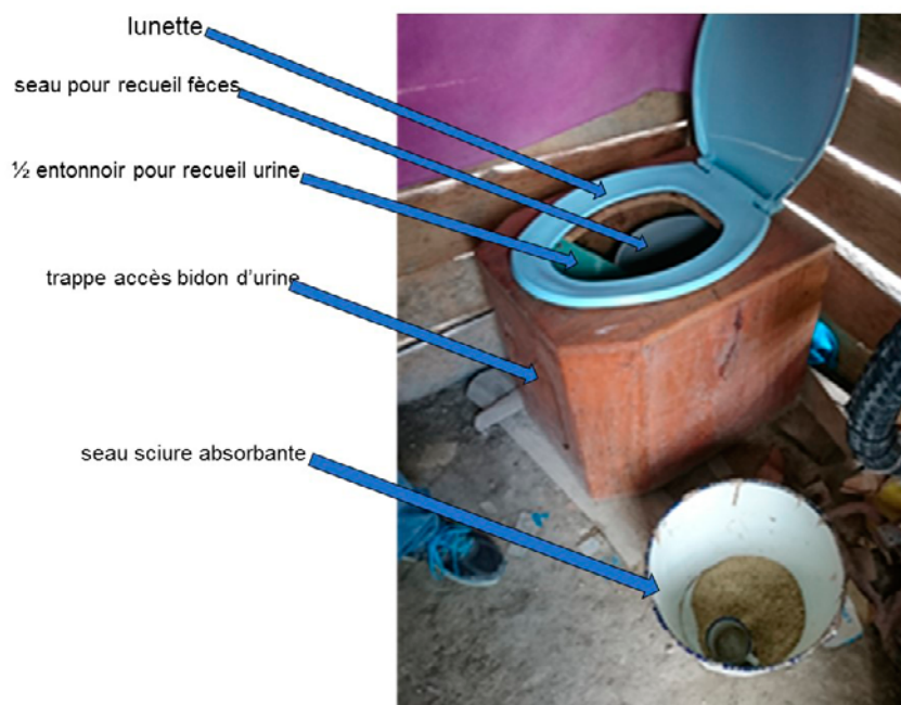
Figure 2. Module de TSLB

Un module, ou interface utilisateur, est constitué des éléments suivants (Figure 2) :