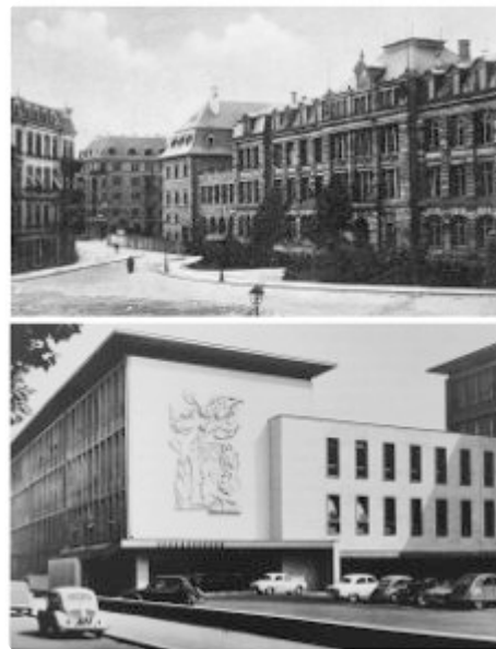
Fig. 2 : L'École impériale technique – l'ENSAIS. En haut, bâtiment rue Schoch, 1896, J.-K. Ott arch. ; extension, 1906, F. Beblo arch. Carte postale [1910]. En bas, bâtiment bd de la Victoire, 1955, F. Herrenschmidt, J. Démaret arch., vue vers 1969.

En juin 1953, un programme détaillé est transmis par le directeur de l'ENIS 19 , ramenant la surface générale à 29 000 m 2 , pour un effectif total de 560 élèves, dont 80 élèves ingénieurs-architectes, et selon une pédagogie décrite comme suit : « Ce système doit favoriser l'émulation entre années et la coopération à l'enseignement des élèves des dernières années