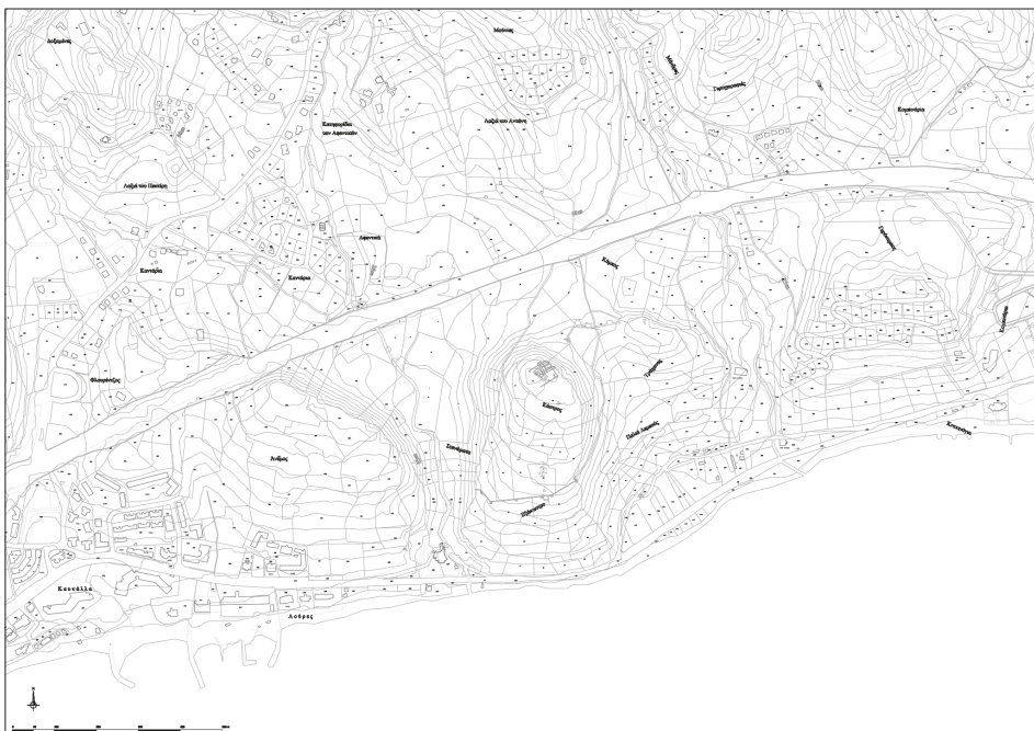
Fig. 38 — Plan topographique et cadastral du site d'Amathonte, exploité comme fond de carte pour le SIG (Department of Lands and Surveys, Chypre).

interrogations, ou bien, avec un procédé inversé, de réaliser des interrogations à partir des éléments cartographiés.