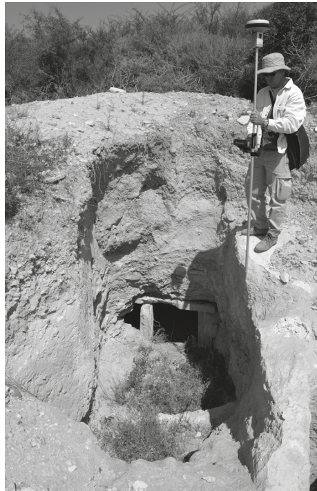
Fig. 40 — L. Fadin géoréférence la T. 957 dans la Nécropole Ouest, 4 avril 2014.

À chacune des tombes représentées sur la carte correspond une entrée dans la base de données relative enregistrant toutes les informations disponibles (sur l'architecture, le matériel, le rite funéraire, etc.), ainsi qu'une chronologie, dont la fiabilité fait l'objet d'une évaluation et correspond, visuellement, à une nuance de couleur. Cette base de données, particulièrement longue à réaliser, est actuellement en phase de complètement. Les 312 tombes fouillées par la mission britannique à la fin du XIX e s., localisées de manière très approximative dans la publication 30 et pour lesquelles on dispose de quelques renseignements supplémentaires grâce aux carnets de fouilles conservés au British Museum, sont également intégrées à la base de données générale, mais elles font en plus l'objet d'une étude à part, le but étant de vérifier si une partie de ces tombes (et en cas affirmatif, lesquelles) ont été fouillées (et donc inventoriées) plusieurs fois. Ce travail est confié à J. Durin, co-auteur de la publication en cours Nécropole d'Amathonte VII et chargée, pour cette publication, de l'inventaire des tombes amathousiennes, y compris les tombes anglaises (en collaboration avec Th. Kiely).