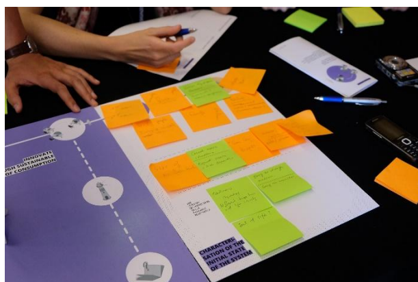
Figure 3 : Boîte à outils en situation lors d'un atelier d'éco-idéation