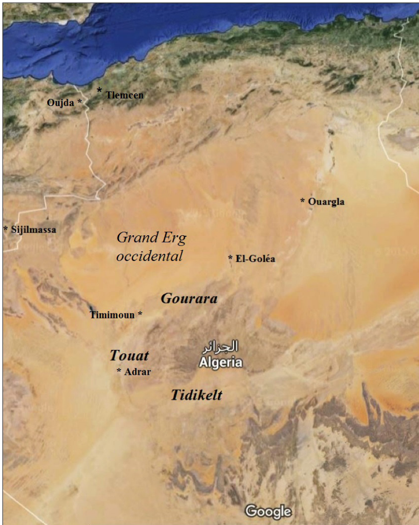
Figure 2 – Fonds de carte Google annotée par E. Voguet.