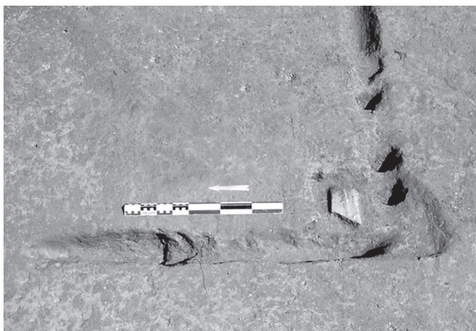
Figure 2 : Le mobilier néolithique dans la trace agraire.