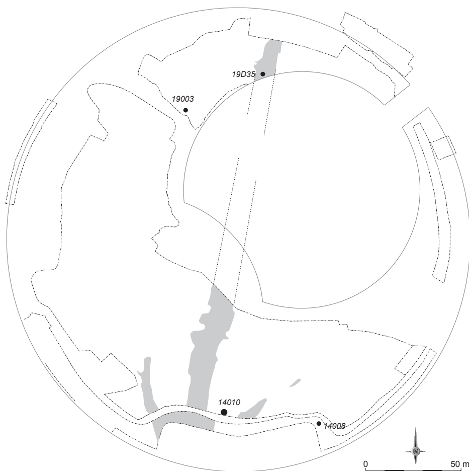
Figure 1 : Localisation des vestiges du Néolithique final (DAO : Bourgarel, I. Daveau).

extrémités de la surface explorée : à la partie nord de la vasque en zone 19 (Fait 19003 et couche 19D35, à la base du chenal principal) et à sa partie sud, en zone 14 (14008 et 14010). Leur niveau