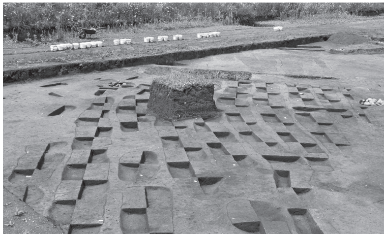
Fig 5 - Les Queyriaux (Cournon d'Auvergne, Puy-de-Dôme), ensemble de fossés segmentés parallèles, lot 1. Possibles structures agricoles. Néolithique moyen ou Bronze moyen.