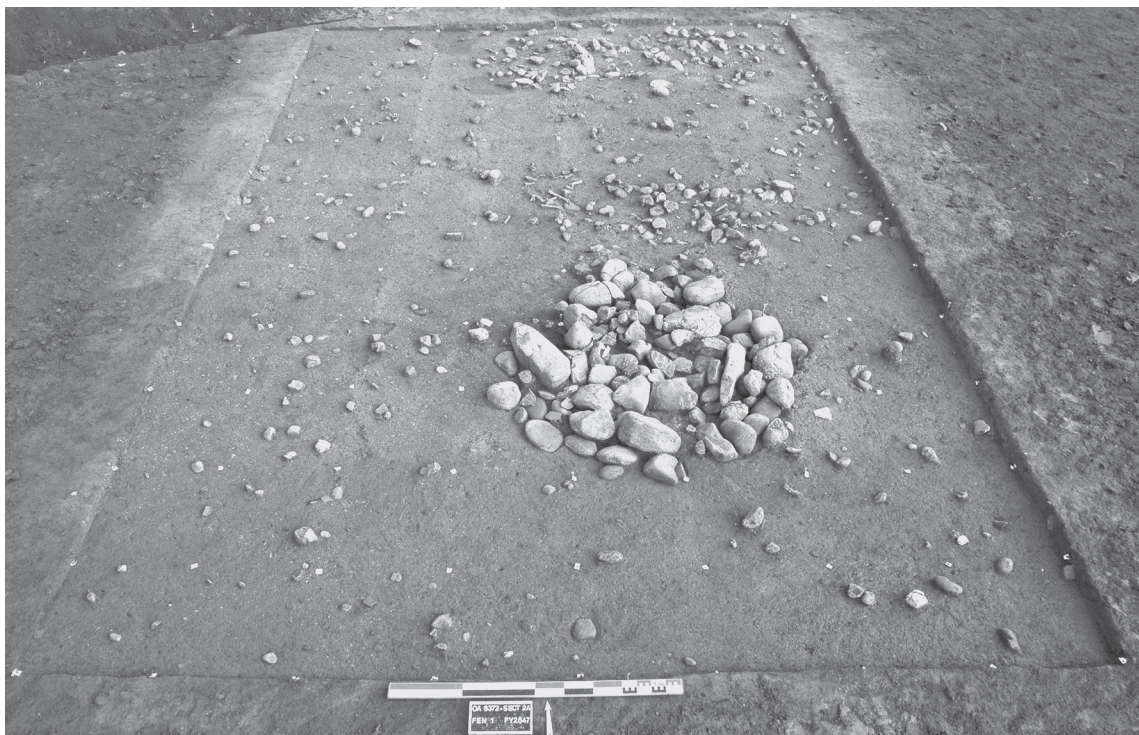
Fig 3 - Les Queyriaux (Cournon d'Auvergne, Puy-de-Dôme), sol d'occupation du Néolithique moyen chasséen ; les activités s'organisent autour des foyers à pierres chauffées.