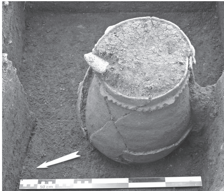
Fig 2 - Les Queyriaux (Cournon d'Auvergne, Puy-de-Dôme), vase du Bronze moyen installé au fond d'une fosse, son ouverture correspondant au niveau du sol de circulation. Une plaquette de marno-calcaire a été taillée et placée au sommet du vase. Cette roche claire a pu servir de bouchon ou à signaler la présence du vase enterré.