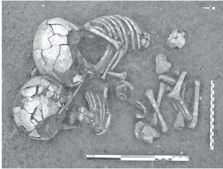
Fig 4 - Les Queyriaux (Cournon d'Auvergne, Puy-de-Dôme), sépulture double d'individus immatures, Néolithique moyen chasséen. Le contact entre les deux têtes et le fait que les membres inférieurs du sujet de gauche soient placés entre les membres inférieurs du sujet de droite attestent la simultanéité du dépôt.