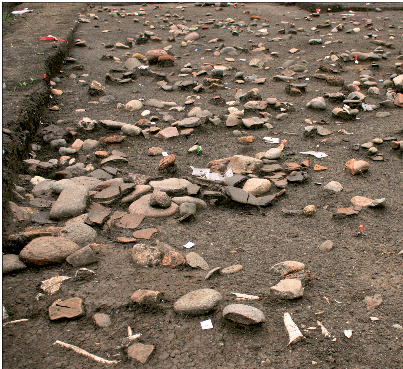
Fig. 1 – Détail du niveau de sol du Néolithique moyen chasséen (secteur 3B) avec le mobilier posé à plat.

part car leur répartition permettait de balayer largement la superficie de l'emprise, et d'autre part car les cortèges de vestiges qu'ils renfermaient témoignaient d'activités différentes (de production, de consommation et de rejet). Il s'agissait en effet de favoriser les comparaisons entre ces différents secteurs d'activité pour appréhender leur complémentarité et éventuellement la spécialisation des espaces. Au total, 2 000 m 2 de sols denses ont été fouillés manuellement (avec tamisage systématique à l'eau des sédiments enlevés), et les 4 000 structures recensées sur le site ont été traitées exhaustivement.