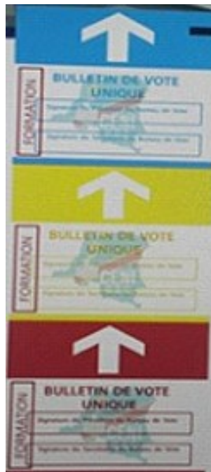
Figure 2 : fac-similé du bulletin de vote pour les trois élections.