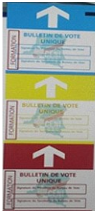
Figure 2 : fac-similé du bulletin de vote pour les trois élections.