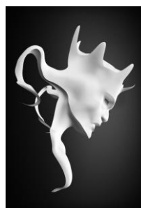
Sculpture virtuelle (LIRIS et LJK)