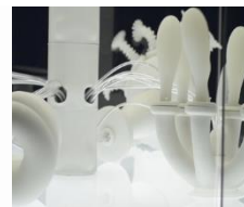
La mer est mon miroir, lab-Sticc, et RCO, LRI.