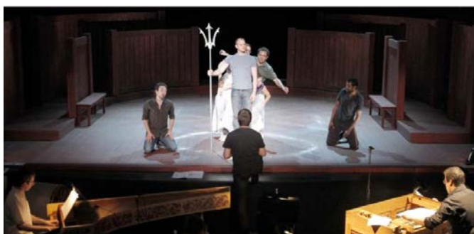
Spectacles en ligne (LJK, CERILAC, LIRIS)