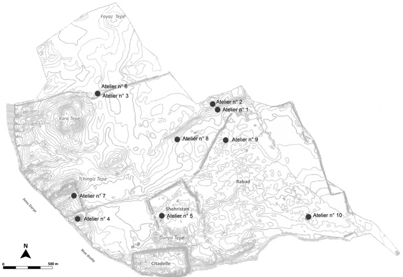
Figure 1 Plan des ateliers connus (Dessin, Leriche P., Pidaev S.)

N'est pas la mise en page, c'est juste un aperçu