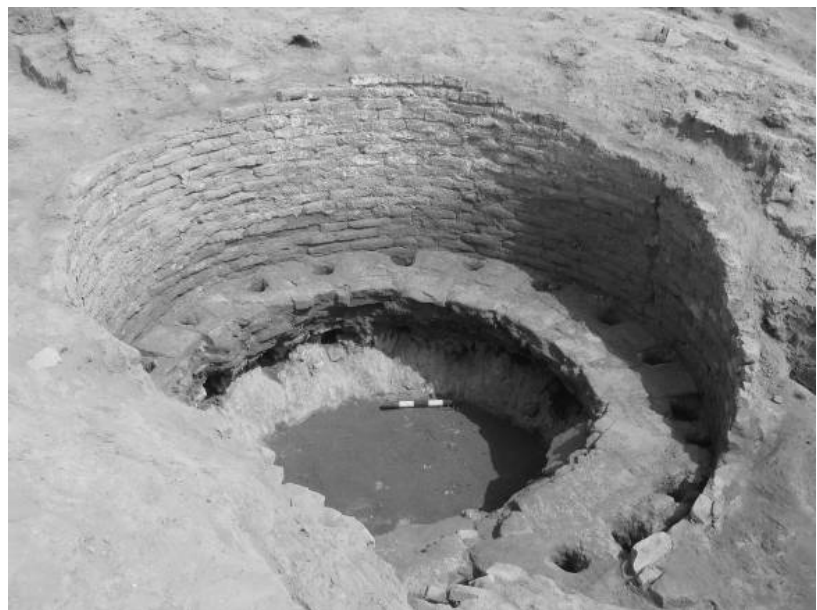
Figure 2 Four de l'atelier n°7