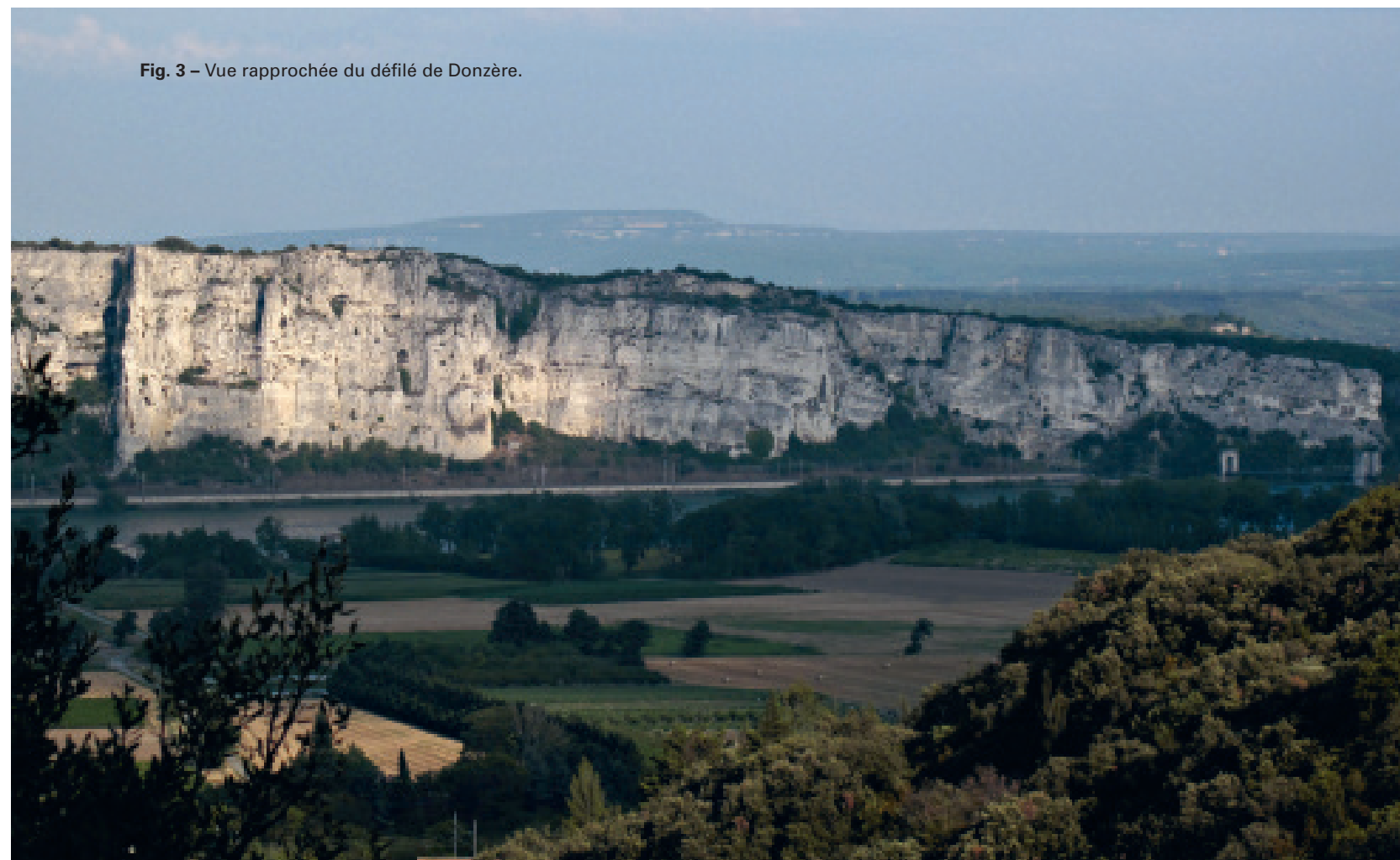
Fig. 3 – Vue rapprochée du défilé de Donzère.