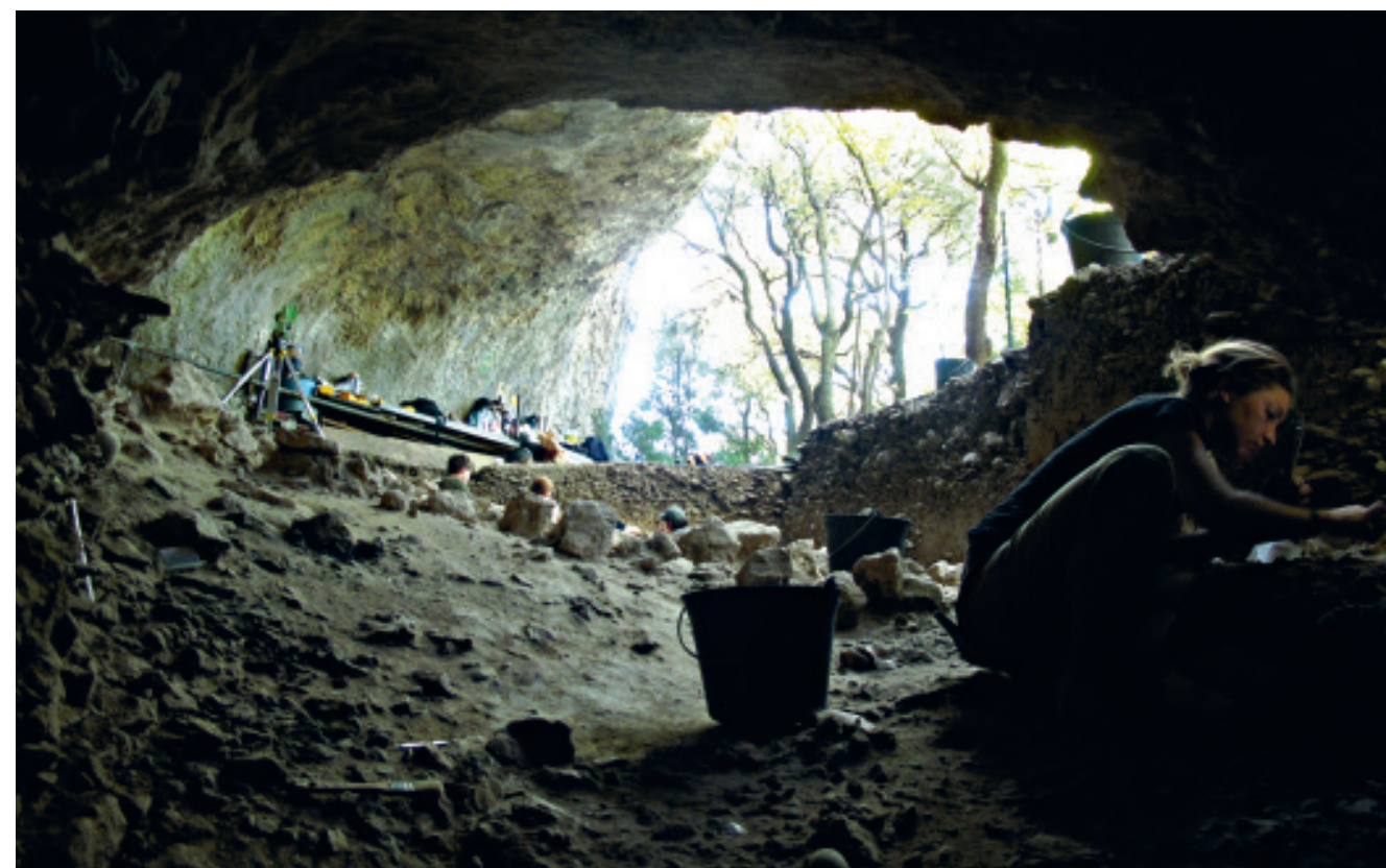
Fig. 4 – Grotte Mandrin, morphologie de la voûte surplombant le site

culturelle et historique propre aux dernières sociétés néandertaliennes en France méditerranéenne 5 . Aucun autre ensemble de l'espace méditerranéen français, et, plus largement, du nord de l'Italie à la Catalogne et jusqu'au Bassin parisien au nord, ne présente une telle richesse et une telle continuité d'enregistrements archéologiques pour aborder ces problématiques.