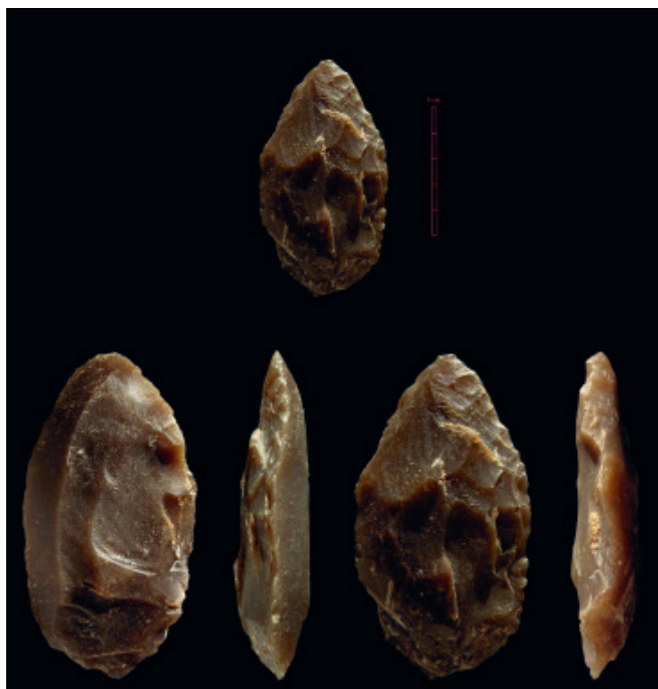
Fig. 5 – Grotte Mandrin, outil de la couche F : « limace amincie » (Quina rhodanien).