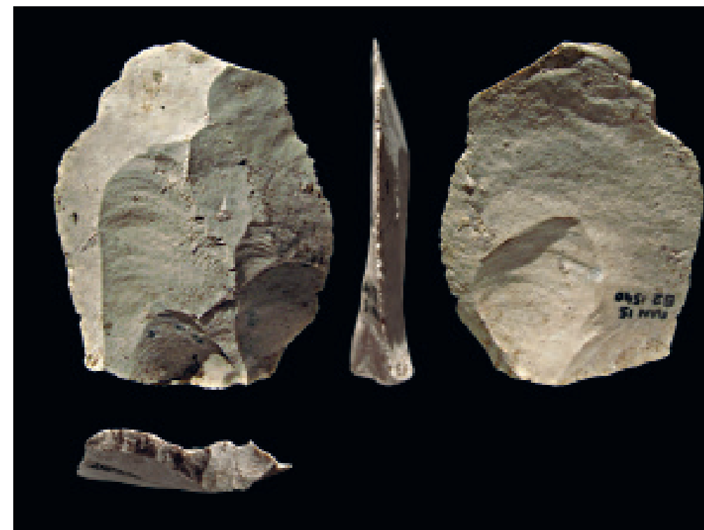
Fig. 7 – Grotte Mandrin couche B2: ultime phase d'installation du Post-Néronien II correspondant donc à l'ultime installation moustérienne, contemporaine du Protoaurignacien: éclat Levallois préférentiel.

En fin de séquence, la position chronologique du premier Protoaurignacien, eu égard aux dernières sociétés locales de tradition moustérienne, est particulièrement éclairante. Ce Protoaurignacien, positionné vers le 42 e millénaire, s'installe dans la cavité, sans réelle rupture dans le temps vis-à-vis des ultimes sociétés néandertaliennes. Cette chronologie du Protoaurignacien de la Grotte Mandrin compte actuellement parmi les plus anciennes actuellement enregistrées en Europe, les industries de la couche B1 pouvant bien être contemporaines de certains Châtelperroniens tels que l'on peut les rencontrer dans le nord de la Bourgogne par exemple 11 .