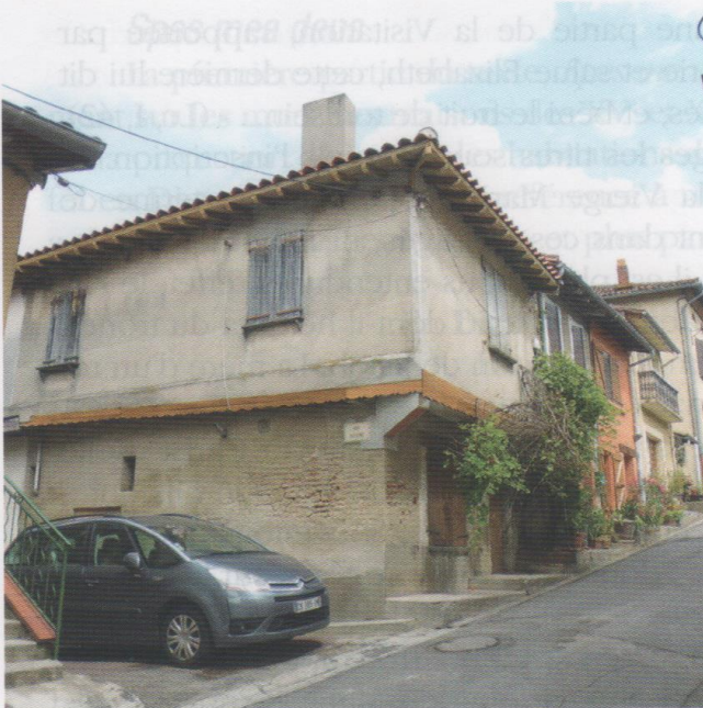
La fameuse maison de Cintegabelle.

le nom de Marie signifie « Notre Dame ». (8) Quelques siècles plus tard, Isidore de Séville reprendra cette affirmation, en précisant qu'on la désigne comme cela « car elle donna le jour au Seigneur » (Livre VII, 10). (9)