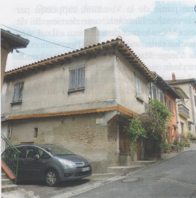
La fameuse maison de Cintegabelle.

le nom de Marie signifie « Notre Dame ». (8) Quelques siècles plus tard, Isidore de Séville reprendra cette affirmation, en précisant qu'on la désigne comme cela « car elle donna le jour au Seigneur » (Livre VII, 10). (9)