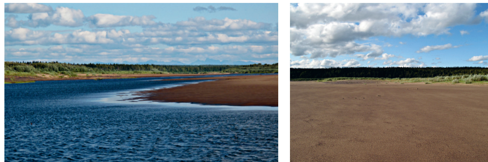
Fig. 1 – Vue de l'Oural polaire depuis le gisement de Byzovaya sur les berges du fleuve Pechora