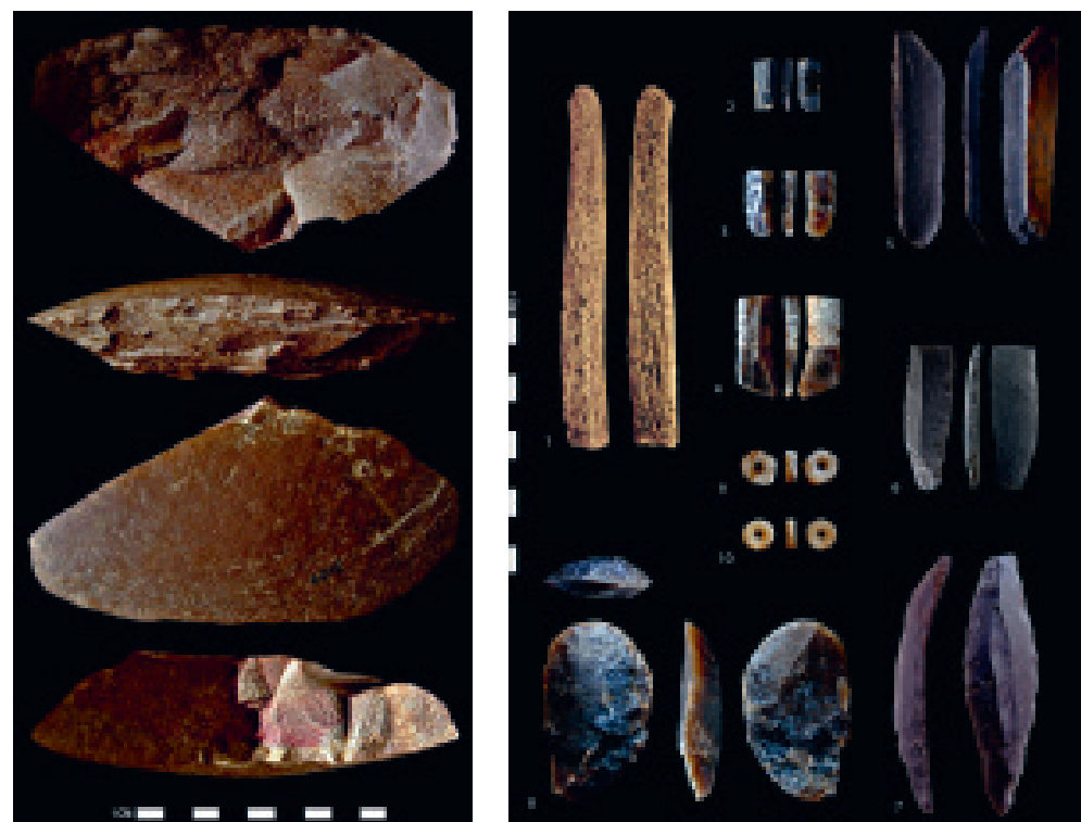
Fig. 3 – Grand racloir moustérien du gisement de Byzovaya. Fig. 4 – Outils et parures du début du Paléolithique supérieur du gisement de Zaozer'e, en zone subpolaire. Cet ensemble, pourtant proche chronologiquement et géographiquement du gisement moustérien de Byzovaya, se distingue par des productions caractéristiques du Paléolithique supérieur : lames et lamelles obtenues par percussion organique, grattoirs, industrie osseuse et parures obtenues par tronçonnage et perçage de fossiles.