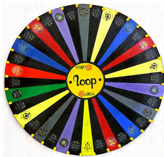
Figura 1. Ruleta Loop.