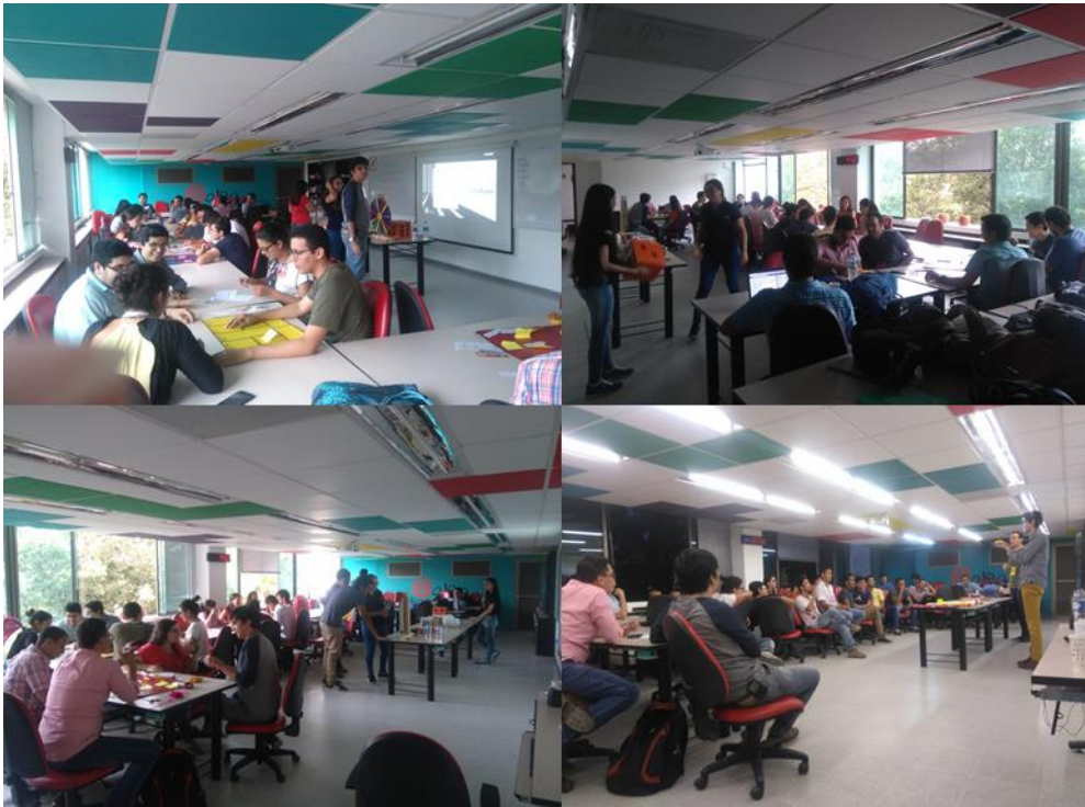
Figura 4. Sesiones de la Lúdica.