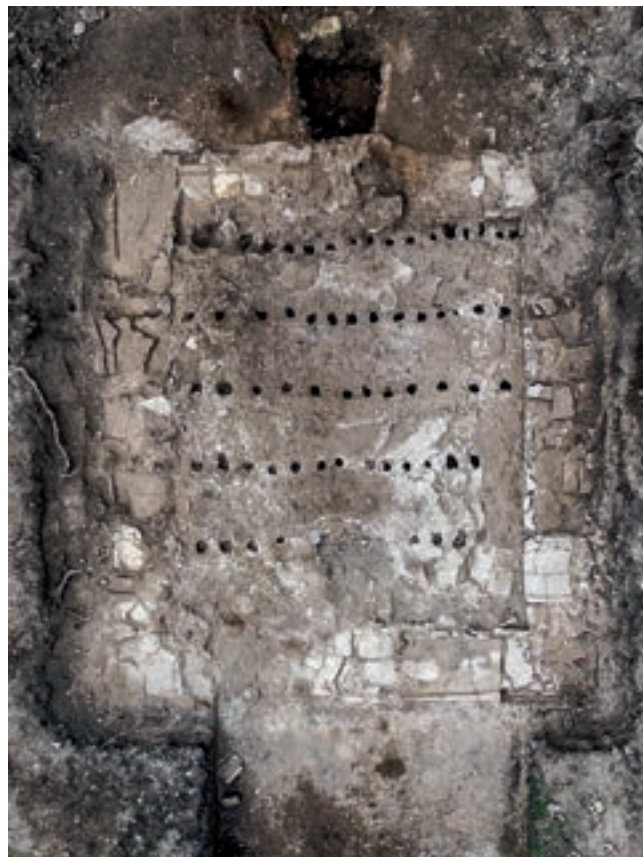
Fig. 168 – MÉRINDOL, Les Borrys, Le Moulin (phase 2). Vue zénithale du four.

Dans la partie ouest, des galeries en relation avec des salles sur hypocaustes ornées d'enduits peints ont été également mises en évidence. Plusieurs canalisations, réseaux d'égouts, bassins et vasques avaient également été signalés lors des fouilles du début du XX e siècle.