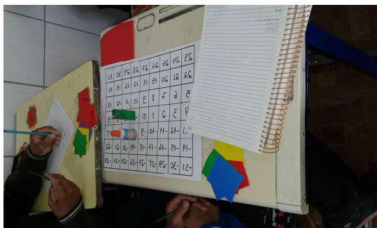
Figura 1- Alunos jogando em dupla

A vantagem do uso de jogos com material manipulável é que ele pode ser adaptado para atender as necessidades de uma determinada turma, o que não poderia ser feito se o jogo fosse digital, pois a maioria não permite mudança no seu formato ou nas regras a serem seguidas.