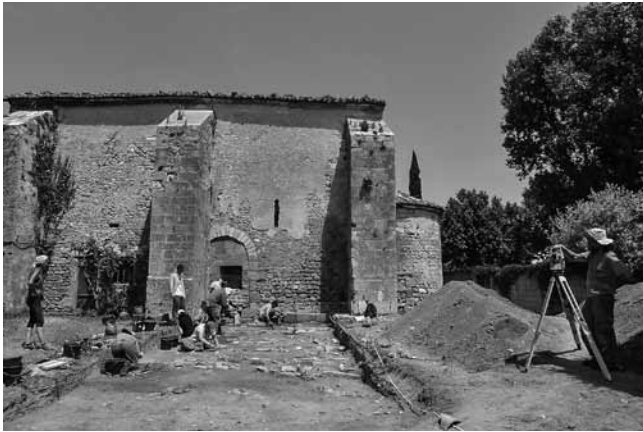
Fig. 211 – L'ISLE-SUR-LA-SORGUE, chapelle Saint-Andéol de Velorgues. Vue du sondage en cours de fouille au sud de la chapelle.

d'un premier édifice – dont la fonction d'église pourrait être attestée par la découverte dans le mur de l'abside XI e s. d'un fragment de table d'autel paléochrétien, en marbre orné d'un chrisme –, nos investigations sur l'architecture permettent de retracer assez précisément l'histoire du bâtiment. L'église actuelle a probablement été construite au XI e s., après l'arrivée des moines de Montmajour en l'an Mil. La nef charpentée était prolongée