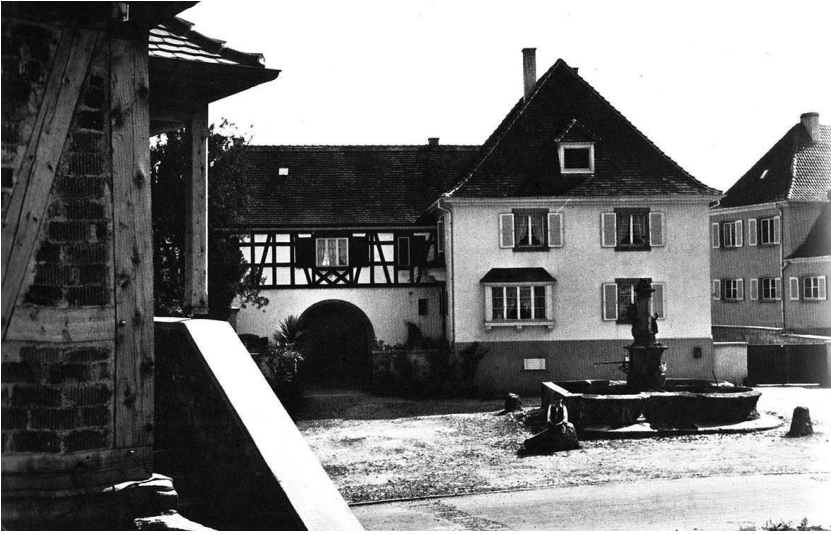
Fig. 2 : Ferme viticole, place de la Sinn à Ammerschwihr, 1948, architecte C.-G. Stoskopf, photographie d'Alice Bommer.