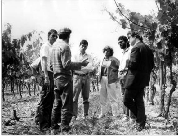
Le Ceta est une coopérative d'idées où tout peut se