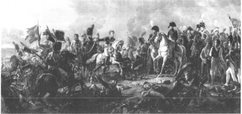
Fig. 5 - Jean Godefroy d'après François Gérard, La Bataille d'Austerlitz , Paris, Bibliothèque nationale de France, département des Estampes.

canons, le prince Reppine et plus de 800 prisonniers nobles de la garde russe » 101 . Selon le général Rapp 102 , l'idée de la composition venait de Napoléon lui-même : « J'allais rendre compte de cette affaire à l'Empereur. Mon sabre à moitié cassé, ma blessure, le sang dont j'étais couvert, un avantage décisif remporté avec aussi peu de monde sur l'élite des troupes ennemies lui inspirèrent l'idée du tableau qui fut exécuté par Gérard ». Gérard reçut 50.000 fr pour ce tableau qui devait être terminé pour l'exposition du 15 août 1808. Avant d'être installé au plafond de la salle du Conseil d'État aux Tuileries, l'œuvre fut exposée au salon de 1810, puis de nouveau en 1811, où il fit sensation 103 . Les Mémoires du général de Marbot (1782-1854) confirment les dires du général Rapp : « j'étais présent à cette scène si imposante, que ce peintre a reproduite avec une exactitude remarquable. Toutes les têtes sont des portraits, même celle de ce brave chasseur à cheval qui, sans se plaindre, bien qu'ayant le corps traversé d'une balle, eut le courage de venir jusqu'à l'Empereur et tomba raide mort en lui présentant l'étendard qu'il venait de prendre ! (...) Napoléon, voulant honorer la mémoire de ce chasseur, prescrivit au peintre de le placer dans cette composition » 104 .