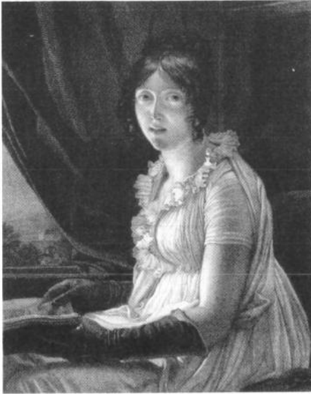
Fig. 1 - Jean Godefroy d'après François Gérard, Portrait de Mme Barbier-Walbonne , Paris, Bibliothèque nationale de France, département des Estampes.