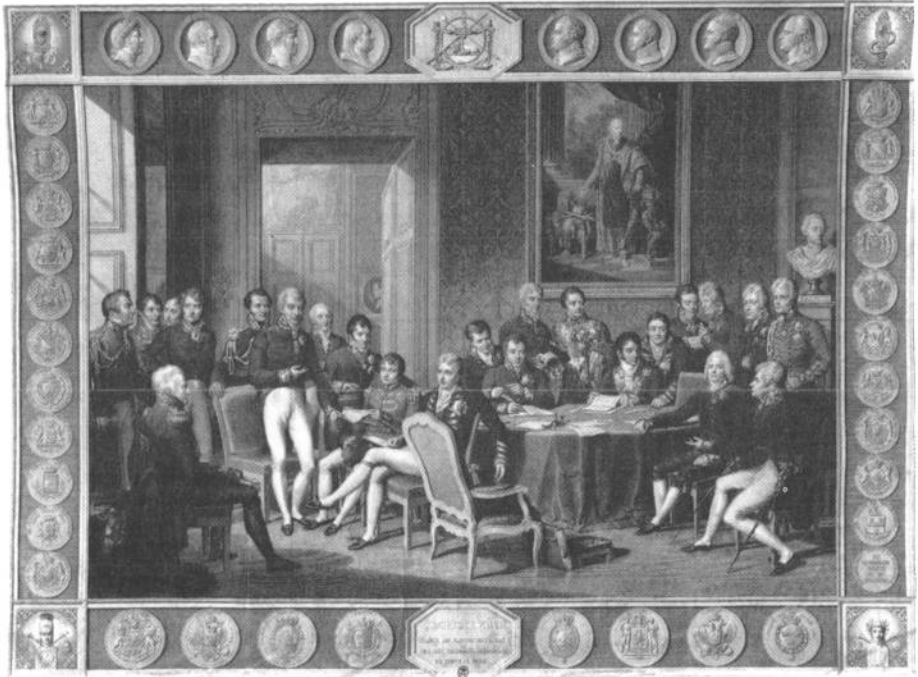
Fig. 4 - Jean Godefroy d'après Jean-Baptiste Isabey, Le Congrès de Vienne , Paris, Bibliothèque nationale de France, département des Estampes.

Prud'hon ne tarissaient pas d'éloges sur ces deux gravures, et avaient surnommé Godefroy le Corrège français . Mais hormis quelques autres compositions, Godefroy travailla avant tout d'après les œuvres des artistes contemporains : d'après Frédéric Schall ( La Fausse apparence , 1800), Carle Vernet ( La mort d'Hippolyte et Le retour de la course , 1804), Antoine Chaudet ( Portrait de Napoléon et Énée , 1809, dédié par Godefroy à « Monsieur le Chevalier Denon membre de l'Institut et directeur des Musées »), Elisabeth Chaudet ( Le Matin , 1800), Gérard ( Mme Barbier-Walbonne , 1798, L'Amour et Psyché , 1801, La Bataille d'Austerlitz , 1813), Isabey ( Le Congrès de Vienne (fig. 4), 1819). Il grava également quelques planches d'après ses propres dessins : en 1810, le portrait de Marie-Louise dans le parc de Saint-Cloud , en 1812 celui du compositeur Dussek , et en 1814 ceux de membres de la famille royale : du Duc d'Angoulême , du Duc et de la Duchesse de Berry 38 , de Louis XVIII ... C'est alors que sa réputation s'accrut. Ces derniers portraits connurent une diffusion considérable, car selon Lacroix, personne en France n'avait encore gravé leurs effigies. Godefroy les dessina ad vivum , dès leur arrivée en France, et les interpréta immédiatement, devançant ainsi ses concurrents.