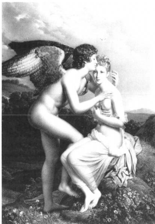
Fig. 8 - Hyacinthe Aubry-Lecomte d'après François Gérard, L'Amour et Psyché , Paris, Bibliothèque nationale de France, département des Estampes.

Le 22 février 1829, le Journal des Artistes consacre un article aux Contrefaçons . Bien qu'aucun nom ne soit cité, quelques allusions sont claires, et tout porte à croire que les protagonistes de l'affaire évoquée ne sont autres que Godefroy et Aubry-Lecomte et que la gravure concernée est l'Amour et Psyché (fig.8) : « Enfin, la publication d'une planche lithographiée des plus importantes est en ce moment entravée par les prétentions élevées par un graveur qui se prétend contrefait, ou qui du moins croit avoir seul le droit de reproduire par la gravure un tableau dû à l'un de nos grands peintres, et devenu la propriété du gouvernement ». Or, l'estampe d'Aubry-Lecomte avait paru le 4 janvier, et la même revue l'avait fait savoir à ses lecteurs : « La belle copie lithographiée de la Psyché de M. Gérard par M. Aubry-Lecomte est achevée et sera incessamment livrée aux amateurs. Cet habile lithographe semble se surpasser lui-même à chaque production nouvelle. Il est impossible de