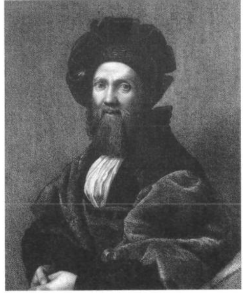
Fig. 2 - Jean Godefroy d'après Raphaël, Portrait de Balthasar Castiglione , Paris, Bibliothèque nationale de France, département des Estampes.