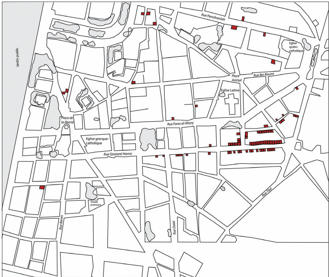
Figure 2 : 'Aziziyé, meubles. Cartographie : T. Boissière.

à une clientèle mixte (avec Benetton comme modèle), ouverts donc à la fois aux femmes et aux hommes, une nouveauté dans ce domaine à Alep 8 mais dont le principe s'applique désormais aux nouveaux grands espaces du commerce (zones commerciales, malls ) qui se développent dans l'ouest de la ville.