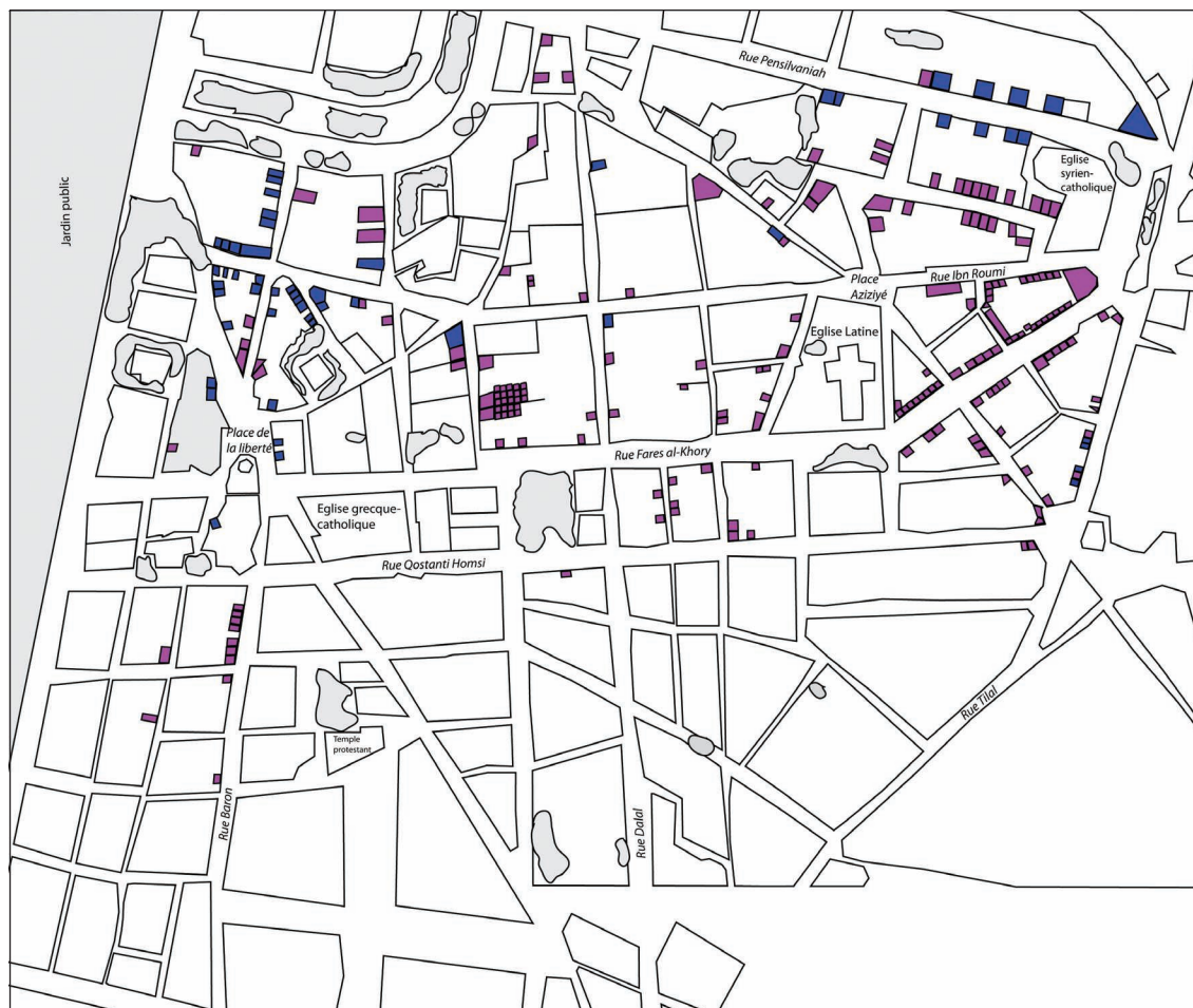
Figure 3 : 'Aziziyé, chaussures hommes (mauve) et femmes (bleu). Cartographie : T. Boissière.