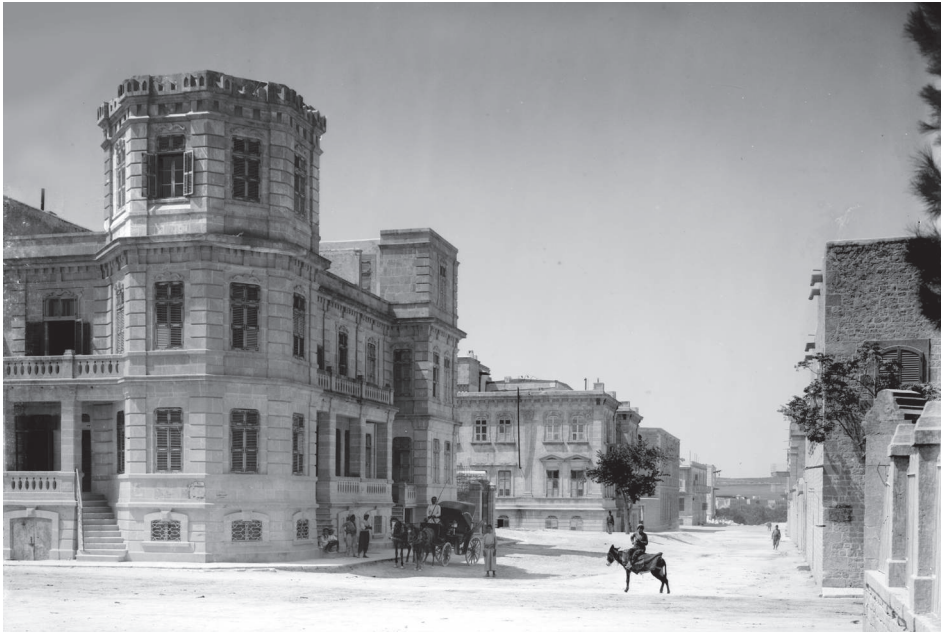
Photo 1 : Photo ancienne de la rue principale du quartier 'Aziziyah et les belles demeures de riches chrétiens construites entre 1900 et les années qui ont suivi la Première Guerre Mondiale (photo des années vingt, auteur non connu. Musée photographique de la Syrie, Library of Congress Prints and Photographs Division).

خلاصة - تقع العزيزية شمال غربي مدينة حلب القديمة، وهي جزء من المناطق السكنية التي تطوّرت أواخر القرن التاسع عشر التي اندمجت تدريجياً في مركز المدينة. كانت العزيزية حتى ستينات القرن العشرين الحي السكني الرئيس بالنسبة إلى الطبقة المسيحية البرجوازية المتوسطة والكبيرة، ثم تحوّلت بسرعة. وقد تطوّرت نشاطها التجاري، الذي كان يقتصر حتى ذلك الحين على بعض "متاجر الأحياء"، تطوّراً هائلاً وانفتح على زبائن أوسع. خلال بضع سنوات، تحوّل حي العزيزية من حيّ سكنيّ بشكل أساسي إلى أحد المراكز الرئيسية للتجارة "الحديثة". ومع أنّه أصبح مركزاً تجارياً لا يمكن تجاهله، فقد دخل منذ نحو خمسة عشر عاماً طوراً جديداً في تاريخه، يتميّز في آن معاً بتكثيف نشاطاته التجارية وتحوّل في نوعية زبائنه، الذين أصبحوا أكثر فأكثر من المنتمين إلى الطبقات الاجتماعية الشعبية، وتجديد لغالبيّة تجاره. ينبغي إدراج هذا الطور الجديد على نحو أعمّ ضمن التغيرات الكبيرة التي عرفت مناطق التجارة ونشاطاتها في حلب، وتتميز بخاصة بانتقالها إلى الأحياء السكنية الجديدة والغنية في طرفي المدينة الغربي والشمالي الغربي.