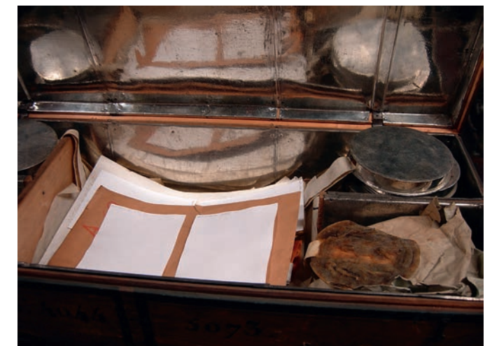
Figure 6. Layette de la constitution de 1790, peuplier.