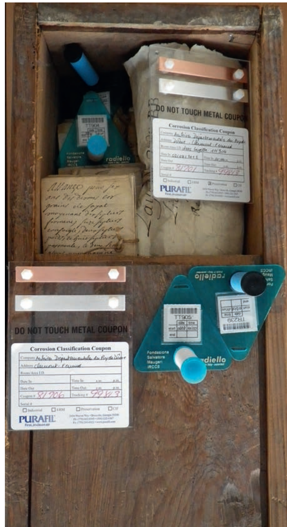
Figure 4. Exposition de coupons Purafil et de tubes Radiello® dans une layette et dans l'ambiance aux archives départementales du Puy-de-Dôme.

À Nantes, les 107 layettes en chêne des XV e et XVI e siècles peuvent être différenciées en trois groupes : les plus anciennes, contemporaines d'Anne de Bretagne, sont assemblées par queues d'aronde larges, elles mesurent 52 cm de long et 30 cm de large, leurs parois font 15 mm d'épaisseur ; 68 sont assemblées en queues