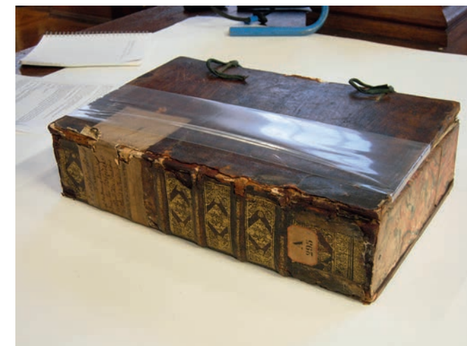
Figure 5. Boîte en chêne.