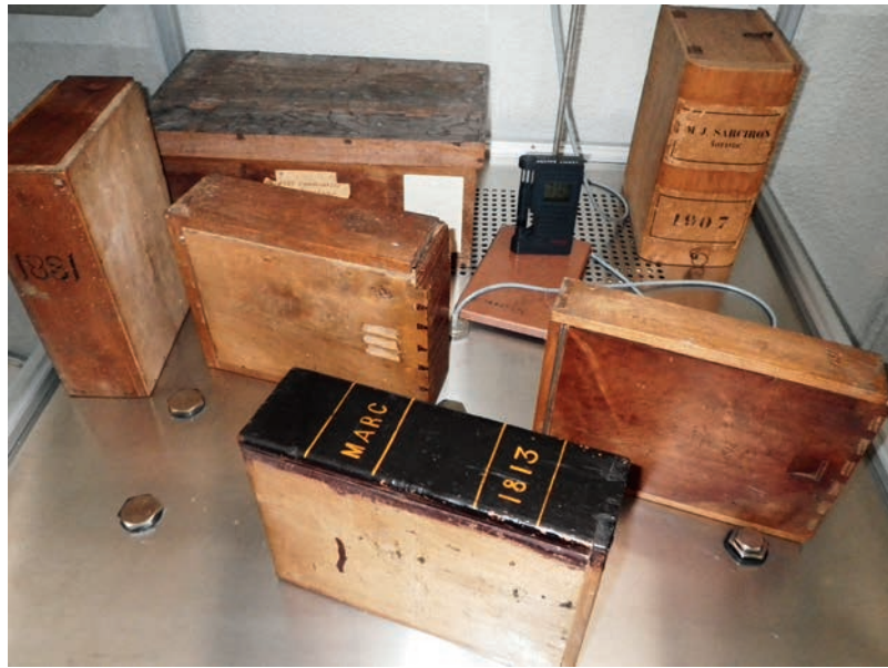
Figure 3. Conditionnement des boîtes des archives du Lot et des Hautes-Pyrénées dans l'enceinte du C2RMF. Les deux boîtes du fond possèdent des systèmes de fermeture à rabats.