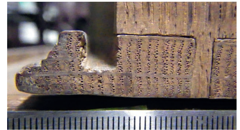
Figure 1. Détail d'une boîte en chêne du trésor des chartes des ducs de Bretagne conservée aux archives départementales de Loire-Atlantique à Nantes. Commandée par Anne de Bretagne au xvi e siècle, elle est parmi les plus anciennes à ce jour en France et montre le soin apporté par les artisans aussi bien dans le débit (radial par clivage) et la mise en œuvre des bois (parage, rainure) que les assemblages (ici en queue d'aronde), permettant aussi la datation de l'objet par dendrochronologie (cernes visibles sur la tranche).

musées de France (C2RMF), le Laboratoire scientifique et technique de la Bibliothèque nationale de France et le Laboratoire d'étude et de recherche sur le matériau bois (LERMAB – ENSTIB) se sont associés, en collaboration avec la société Puratech, spécialisée dans la qualité de l'air, pour tenter de répondre à cette problématique relayée et posée par le service interministériel des archives de France. Le Laboratoire d'archéologie moléculaire et structurale a daté un très large panel de boîtes anciennes par dendrochronologie, en collaboration avec la société Xylodata qui a identifié les essences.