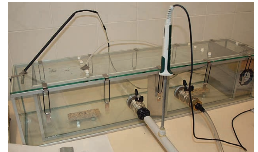
Figure 2. Méthodologie de la chambre d'émissions selon NF EN ISO 16000-9.

Une première série de mesures de composés organiques volatils (benzène, toluène, éthylbenzène, xylènes (BTEX) et composés carbonylés) a été réalisée en chambre d'émissions (51 litres) sur 7 couvercles en chêne (surfaces d'émission comprises entre 0,11 et 0,22 m 2 ) datés du xiv e, milieu xv e, milieu xvi e, fin xvi e, xvii e, xviii e et xx e siècles (voir figure 2). Des prélèvements passifs sur 28 tubes Radiello® 1 ont été menés dans des conditions climatiques constantes (25°C / 55 % HR) selon la norme NF EN ISO 16000-9 pendant 7 jours [ISO 16017, 2006]. Les échantillons ont été déposés dans la chambre d'émissions après 48 heures de balayage par de l'air propre filtré pour éviter les contaminations éventuelles.