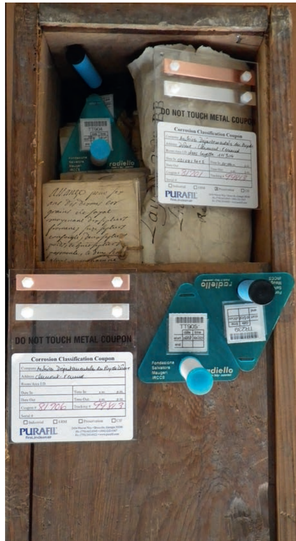
Figure 4. Exposition de coupons Purafil et de tubes Radiello® dans une layette et dans l'ambiance aux archives départementales du Puy-de-Dôme.

À Nantes, les 107 layettes en chêne des XV e et XVI e siècles peuvent être différenciées en trois groupes : les plus anciennes, contemporaines d'Anne de Bretagne, sont assemblées par queues d'aronde larges, elles mesurent 52 cm de long et 30 cm de large, leurs parois font 15 mm d'épaisseur ; 68 sont assemblées en queues