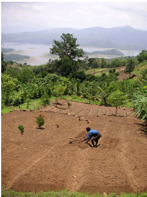
Photo 2. Champs en terrasses à Poppara, vue sur le réservoir de Parambikulam (21.05.05)

Les objectifs des EDC étaient aussi de fournir des activités alternatives à l'utilisation des ressources naturelles, afin que la diminution des emplois de foresterie ne conduise pas les habitants à se tourner vers l'exploitation des produits forestiers non ligneux. Les résultats dans ce domaine étaient limités en 2005 et là aussi hétérogènes. À Poppara, l'EDC fonctionnait bien : il permettait aux habitants d'obtenir de l'argent pour leurs activités agricoles (photo 2) et les villageois avaient construit deux huttes dans les arbres pour accueillir les touristes. L'ouverture de boutiques ou la création de petites unités artisanales (cartons, curry) à PAP Colony, la distribution de semences pour faire des petits jardins à Kuriarkutty ont été des initiatives réussies, mais d'autres activités plus poussées comme le financement d'un poulailler géré par une quinzaine de personnes ou la formation de chauffeurs à Sungam, n'ont pas abouti à un développement économique, faute d'un marché stable et d'une offre d'emplois. L'activité de l'EDC se limitait malgré tout à peu d'activités. Les projets de l'EDC de Fifth Colony échouèrent, inadaptés au style de vie des habitants.