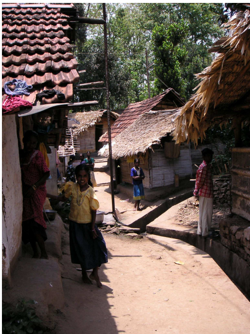
Photo 1. Le village de Kadavu, population croissante et terres limitées (23.05.05)

À part pour les agriculteurs de Poppara qui ont été relativement peu mobilisés dans les emplois forestiers et dans les travaux de construction, les autres groupes sociaux ont vu leurs moyens de subsistance changer radicalement avec la fin de l'exploitation des plantations et la protection de l'espace. Les terres obtenues pour chaque village en 1997 sont trop limitées – et surchargées (photo 1) – pour y pratiquer l'agriculture, et les emplois proposés par le Département des Forêts sont saisonniers. L'arrêt des activités de foresterie conduisit à une augmentation de la dépendance des populations locales vis-à-vis de la forêt : la cueillette des produits forestiers non ligneux pour la vente devenait une source de revenus majeure. Tolérée, elle fut finalement interdite en 2004 avec la mise en application de l'Amendement de 2002.