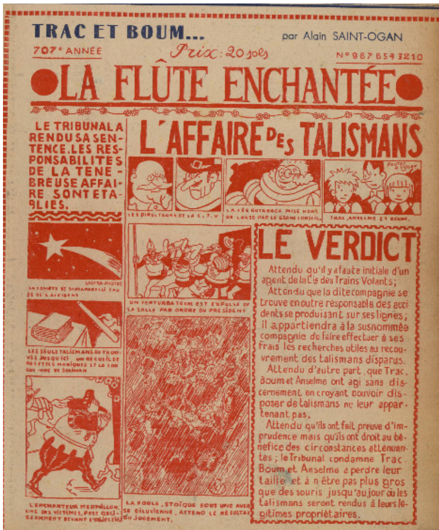
Trac et Boum, dans Benjamin, 1941

Cette planche est la Une d'un journal imaginaire du pays des fées, ironiquement appelé La flûte enchantée . Elle mêle les signes graphiques de l'inscription dans le genre du conte de fées, notamment à travers le titre et l'emploi d'éléments pseudo-médiévaux (le prix est en « sols », les habits des personnages se veulent médiévaux) avec un pastiche, explicite pour qui connaît le monde de la presse contemporaine. Un pastiche à la fois iconographique et textuel :