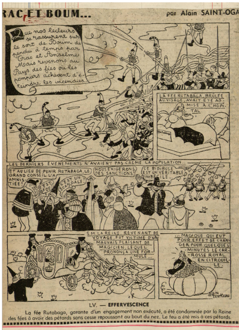
Trac et Boum, dans Benjamin, 1941

Dans la dernière case de cette planche, le carrosse de la reine des fées (lui-même reprise iconographique de l'imagerie d'Epinal, avec un carrosse tiré par des cygnes) se transforme en citrouille, comme dans le conte Cendrillon tiré du recueil de Charles Perrault, ce qui donne lieu à un dessin cocasse de la Reine montée sur une citrouille.