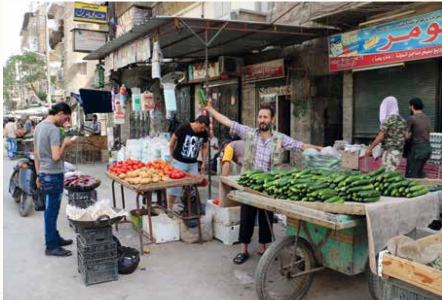
Ci-contre : Marché aux légumes dans une rue du centre, le 29 juin 2014.

L'espace de la ville est divisé en deux parts inégales suivant des critères principalement sociaux : d'une part, les quartiers riches au centre, à l'ouest et au nord-ouest, légaux, peuplés de moins d'un million d'habitants, où la population est majoritairement sunnite, occupés et protégés par les forces loyalistes ; de l'autre, à l'est, au nord, au sud et au sud-ouest, des quartiers de migrants ruraux ou d'habitants venus d'autres quartiers populaires urbains, informels et illégaux, et de grands ensembles de logements construits par l'État (cf. carte p. 89). Ces zones « pauvres » représentent les deux tiers de la ville, soit plus de 2 millions d'individus. C'est dans ces quartiers où les habitants ont souvent gardé des liens avec le monde rural que s'installent les troupes rebelles et que tente de s'organiser un embryon de société civile et d'administration (5). Paradoxalement, les deux grands quartiers populaires d'habitat collectif à loyer modéré construits par l'État, Hanano au nord-est et Salah ad-Din au sud-ouest, ont été parmi les premiers occupés par les rebelles. Dans ces ensembles planifiés, l'accès aux produits de consommation quotidienne et aux services et activités sociales est organisé et offert à des prix subventionnés par l'État. Ces deux projets architecturaux sont différents et caractéristiques de l'évolution idéologique et des choix d'aménagement urbain. Avant la guerre, Hanano était remarquable par ses dimensions