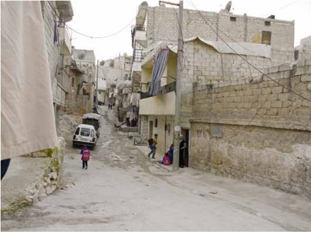
Une rue du quartier informel de Cheikh Maqsoûd.

Khoder, Tariq al-Bab, qui sont des lieux d'affrontement entre les rebelles et l'armée loyaliste depuis le 20 juillet 2012 et d'attaques aériennes. Une majorité des habitants de ces zones a fui vers les quartiers plus à l'ouest ou hors de la ville. Le quartier kurde informel de Cheikh Maqsoûd, très peuplé, a longtemps été interdit d'accès aux rebelles par ses habitants. Le quartier kurde et turkmène voisin, Al-Hollok, à l'est, a été le théâtre d'affrontements entre les forces kurdes d'autodéfense et les troupes du régime ou certains éléments rebelles. Diamétralement opposé, au sud-ouest, Salah ad-Din jouxte les quartiers populaires de Saïf al-Daoulé, d'Ansari et, plus au sud, de Sukkari, lieux de combats et de bombardements depuis juillet 2012. Les quartiers informels et illégaux, régulés ou non, sont eux-mêmes divers. La majorité de la population y est sunnite, installée à Alep depuis une ou deux générations, et son niveau d'intégration à la ville est fonction de traditions, de caractéristiques identitaires ou d'héritages historiques : les catégories qui participent à la définition de ces choix collectifs ne sont pas confessionnelles. Ces habitants revendiquent en général une origine villageoise ou tribale nomade ou semi-nomade ; ils