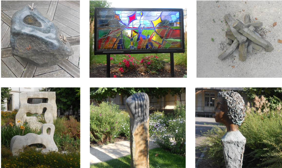
Figure 1. Illustration non-exhaustive d'œuvres du jardin « art, mémoire et vie » ( titre de l'œuvre, forme d'art, représentations, matériaux )

Légende : De gauche à droite : En haut. L'Abreuvoir , figuratif, représentations mimétiques, olivine de Hesse, basalte et éléments en bronze (i.e. oiseau, lézard, papillon) ; Vitrail , figuratif, représentations fortement stylisées, verre plombé ; Feu de camp , figuratif, représentations mimétiques, tuf de Hesse. En bas. Cycle , abstrait, représentations non-objectives, pierre de Lérouville ; Klangstein , abstrait, représentations non-objectives, grès et basalte ; Le Bisou , figuratif, représentations stylisées, bronze.