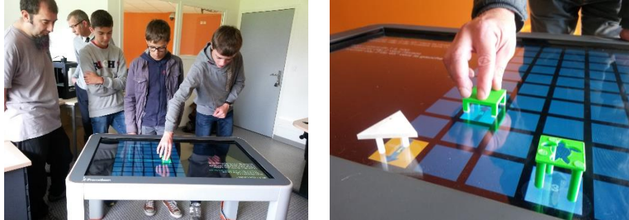
Figure 2. Manipulation d'objets tangibles sur une table interactive