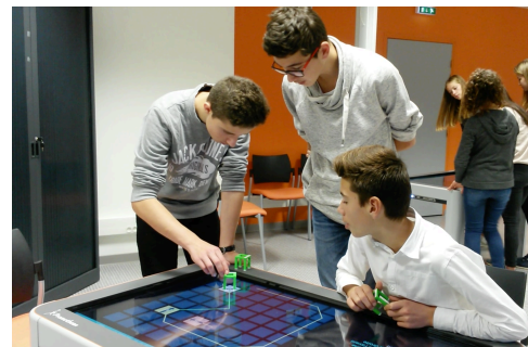
Figure 2 - Collaboration entre élèves

prouvé que, de par l'engagement corporel et l'invitation à l'action, l'utilisation de tels objets pouvait faciliter des apprentissages et les performances [1, 2]. Par ailleurs, tout en rendant les activités plus ludiques et plaisantes, la collaboration entre apprenants est favorisée avec des interfaces tangibles [3]. Certains niveaux de TurtleTable sont conçus pour que chaque élève ait un rôle à jouer en manipulant un objet tangible particulier. Ils doivent ainsi se concerter pour exécuter des instructions impliquant plusieurs objets (figure 2).