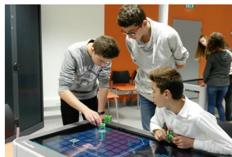
Figure 2 - Collaboration entre élèves

reconnus par une table interactive. De nombreuses études ont prouvé que, de par l'engagement corporel et l'invitation à l'action, l'utilisation de tels objets pouvait faciliter des apprentissages et les performances [1, 2]. Par ailleurs, tout en rendant les activités plus ludiques et plaisantes, la collaboration entre apprenants est favorisée avec des interfaces tangibles [3]. Certains niveaux de TurtleTable sont conçus pour que chaque élève ait un rôle à jouer en manipulant un objet tangible particulier. Ils doivent ainsi se concerter pour exécuter des instructions impliquant plusieurs objets (figure 2).