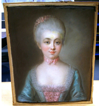
Figure 4 : anonyme français, Portrait de jeune femme en costume Louis XV , XVIII ème siècle (E1426).

perles de blanc de plomb. Les roses du Portrait de jeune femme en costume Louis XV (E1426) sont un mélange de vermillon et de minium, le violet est de l'hématite ; dans le vert, la XRF révèle du chrome qui ne peut pas avoir été employé avant le XIX ème siècle. Les analyses confirment ce qu'avait compris l'historien de l'art, il s'agit d'une copie ou d'une œuvre « à la manière du XVIII ème » siècle effectuée au XIX ème siècle (figure 4).