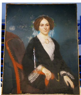
Figure 3 : Bousseton, Dame assise en robe bleue , 1859 (M1582).

Presque tous les bleus sont du bleu de Prusse (ils contiennent du calcium et du fer, parfois du potassium provenant du procédé de fabrication, et du soufre). Les rouges et les roses sont obtenus avec du vermillon dont la couleur est parfois modifiée en ajoutant de l'hématite ( \text{Fe}_2\text{O}_3 ) ou du minium ( \text{Pb}_3\text{O}_4 ). Les jaunes sont surtout à base d'ocre jaune. Pour la Dame assise en robe bleue (M1582) datée de 1859, l'artiste a utilisé un mélange composé de bleu de Prusse et de jaune de chrome utilisé depuis les années 1830 ce qui correspond à la date du pastel (figure 3).