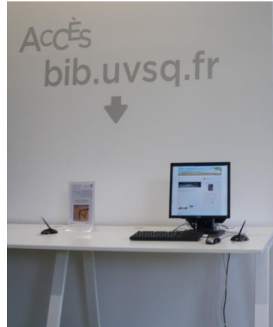
Figure 44 - LC 2, Poste dédié à la consultation du catalogue documentaire