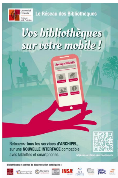
Figure 51 - LC 3, Application Archipel Mobile

Ce calcul de l'affluence est à corrélérer avec l'analyse de l'usage réel de la collection. Ainsi, au LC 2 et au LC 5 en projet est expérimenté le recensement des documents consultés sur place afin de mieux connaître les usages du public et de pouvoir adapter les acquisitions. Le « comptage » sur une semaine est réalisé à partir du dépôt des documents consultés sur des chariots mis à disposition dans les espaces de travail. Le développement d'applications représente pour les tutelles un coût relativement important pour un usage émergent (Fourmeux, 2013). Ce développement n'est possible que pour des réseaux documentaires conséquents.