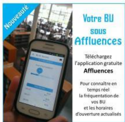
Figure 50 - LC 2, Application Affluence

par le public des bibliothèques universitaires [figure 51]. Cette dernière calcule le taux d'occupation de la bibliothèque et le temps d'attente pour accéder à une place assise.