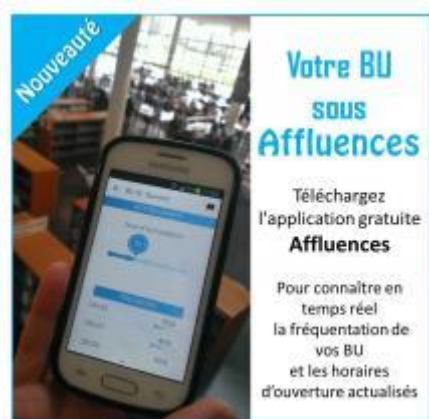
Figure 50 - LC 2, Application Affluence

par le public des bibliothèques universitaires [figure 51]. Cette dernière calcule le taux d'occupation de la bibliothèque et le temps d'attente pour accéder à une place assise.