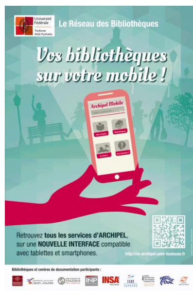
Figure 51 - LC 3, Application Archipel Mobile

Ce calcul de l'affluence est à corrélérer avec l'analyse de l'usage réel de la collection. Ainsi, au LC 2 et au LC 5 en projet est expérimenté le recensement des documents consultés sur place afin de mieux connaître les usages du public et de pouvoir adapter les acquisitions. Le « comptage » sur une semaine est réalisé à partir du dépôt des documents consultés sur des chariots mis à disposition dans les espaces de travail. Le développement d'applications représente pour les tutelles un coût relativement important pour un usage émergent (Fourmeux, 2013). Ce développement n'est possible que pour des réseaux documentaires conséquents.