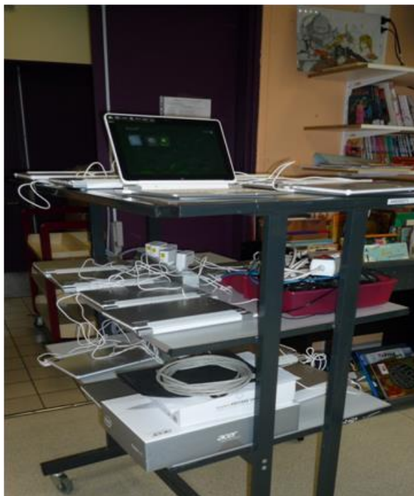
Figure 47 - Gestion du parc de tablettes, LC 8

Le point commun entre ces différentes approches de prêt de matériel est de n'accorder qu'une importance relative aux contenus proposés. Pour des projets au sein de structures documentaires, cette situation apparaît paradoxale. Selon une étude menée à l'université de Grenoble (Maftoul et Bogalska-Martin, 2013), la moitié des étudiants s'attend à ce que la bibliothèque universitaire leur fournisse des revues et des livres sous format numérique. En effet, les bases de données et les bouquets de périodiques électroniques restent encore essentiellement destinés aux étudiants de niveau master et aux doctorants ainsi qu'aux enseignants-chercheurs. Le rapport du consortium Couperin (2009) constate ainsi à propos des achats de livres électroniques que « ce sont des ressources pour les 1ers cycles et en français qui sont privilégiées par les établissements, d'autant que certains projets nationaux ou régionaux, comme le Plan d'Aide à la Réussite en Licence, permettent de trouver des fonds pour financer ces ressources » 5 . La négociation par le Ministère de l'enseignement supérieur de licences nationales dans le cadre du projet ISTE 6 , va permettre d'acquérir des archives de revues et d' e-book . L'adaptation de la collection numérique aux besoins des usagers s'inscrit dans une complémentarité entre ressources numériques et physiques au sein d'une politique documentaire cohérente.