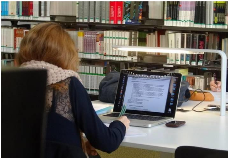
Figure 48 - Ordinateur et téléphone portable personnels, LC 2

Aujourd'hui, la question se pose pour les décideurs de l'intérêt de la mise à disposition de terminaux fixes alors que beaucoup d'étudiants utilisent leurs équipements personnels mobiles et connectés [figure 48]. Le BYOD ( Bring your own device 7 ), c'est-à-dire le fait que les utilisateurs apportent leurs propres terminaux est une réalité qui s'impose à l'université et dans les lycées (LC7 et LC8). En matière d'objets connectés, nos observations se révèlent en concordance avec les résultats de Jean-François Cerisier (2014), c'est l'ordinateur portable qui est le plus répandu, puis le smartphone . La tablette numérique reste encore un équipement marginal.