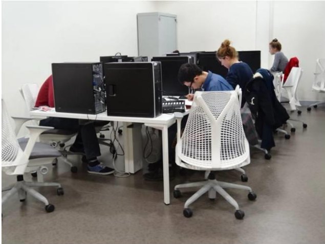
Figure 43 - LC 7B, Espace Informatique

l'utilisation de mobiliers spécifiques [figure 43]. Les postes dédiés à la consultation du catalogue, isolés ou disséminés parmi les rayonnages restent un mode d'inscription du numérique dans les espaces toujours répandu [figure 44]. Toutefois, il convient de rappeler que la recherche documentaire depuis un catalogue en ligne est une pratique peu courante chez les étudiants qui privilégient l'utilisation de moteurs de recherche type « Google » pour leurs travaux académiques (Perret, 2013).