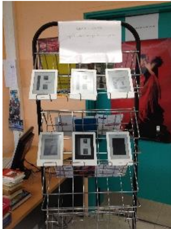
Figure 46 - Prêt de liseuse sur place, LC 8

Dès l'apparition des premières liseuses électroniques, les bibliothèques ont cherché à se positionner en tant que lieu d'acculturation possible aux nouvelles technologies de lecture numérique. Cependant, les contraintes techniques liées au prêt de matériels demeurent nombreuses. Ainsi, le prêt d'ordinateurs portables nécessite d'avoir une armoire sécurisée à l'accueil pour les protéger du vol. L'autonomisation du prêt des cartables numériques est envisagée via la mise à disposition de casiers intelligents (LC 2, projet 2016). Un chariot dédié se révèle également obligatoire pour recharger le parc de tablettes mobiles et en assurer le transport dans les salles de cours [figure 47].