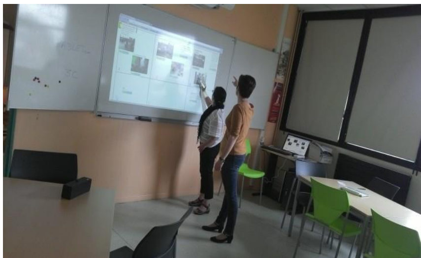
Figure 49 - utilisation du TBI en contexte de formation, LC8

Les formations à la culture informationnelle visent l'appropriation de l'information permettant d'exercer les compétences de citoyen et la capacité à pouvoir répondre aux attentes dans un contexte académique. Les LC sont dotés pour la plupart de salles de formation connectées (avec Tableau Blanc Interactif et vidéoprojecteur) qui permettent de mener des ateliers documentaires et numériques afin d'assurer la formation des étudiants ou élèves. Soit ces salles sont closes et réservées aux ateliers, soit l'espace formation constitue une zone totalement intégrée au centre de documentation modulable en fonction de l'activité pédagogique [figure 49]. La deuxième configuration est davantage présente dans le secondaire en raison des surfaces plus réduites des 3C.