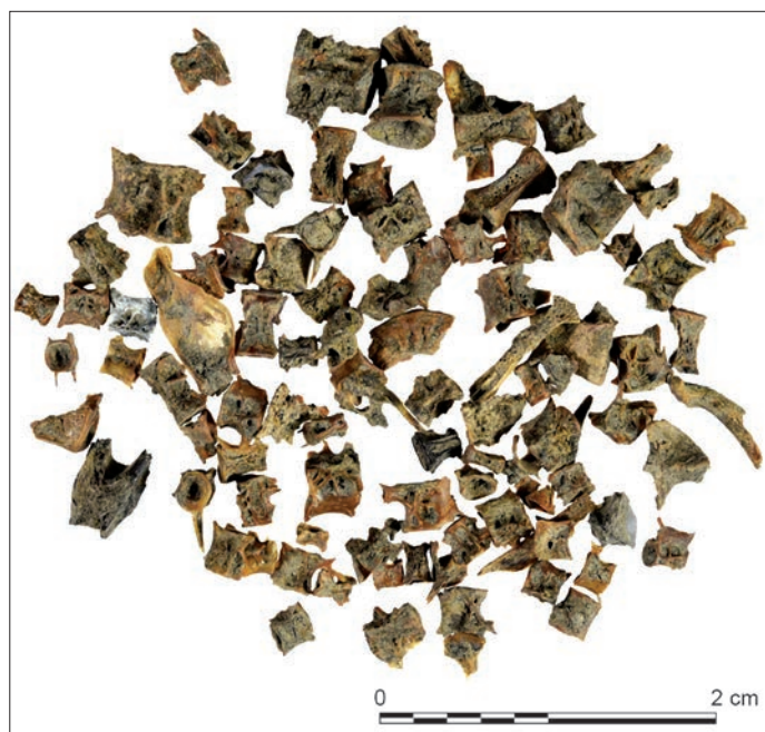
Fig. 3 – Exemple de restes d'ichtyofaune de l'Isle-Saint-Georges (Us 7187, ponction de 10 L, tamisage 1 mm) (cliché : B. Ephrem).

grand nombre d'Us, avec une chronologie couvrant toute l'occupation du site sans fournir d'efforts de tamisage contraignants et inutiles (Sternberg 1995, p. 45). Ce type d'échantillonnage a été maintenu pendant les quatre campagnes suivantes de 2011 à 2014. Les résultats des premiers tests ayant montré une faible densité des ossements au sein des Us, il a été décidé de doubler certains prélèvements (jusqu'à 40 litres) pour en augmenter les données quantitatives et qualitatives.