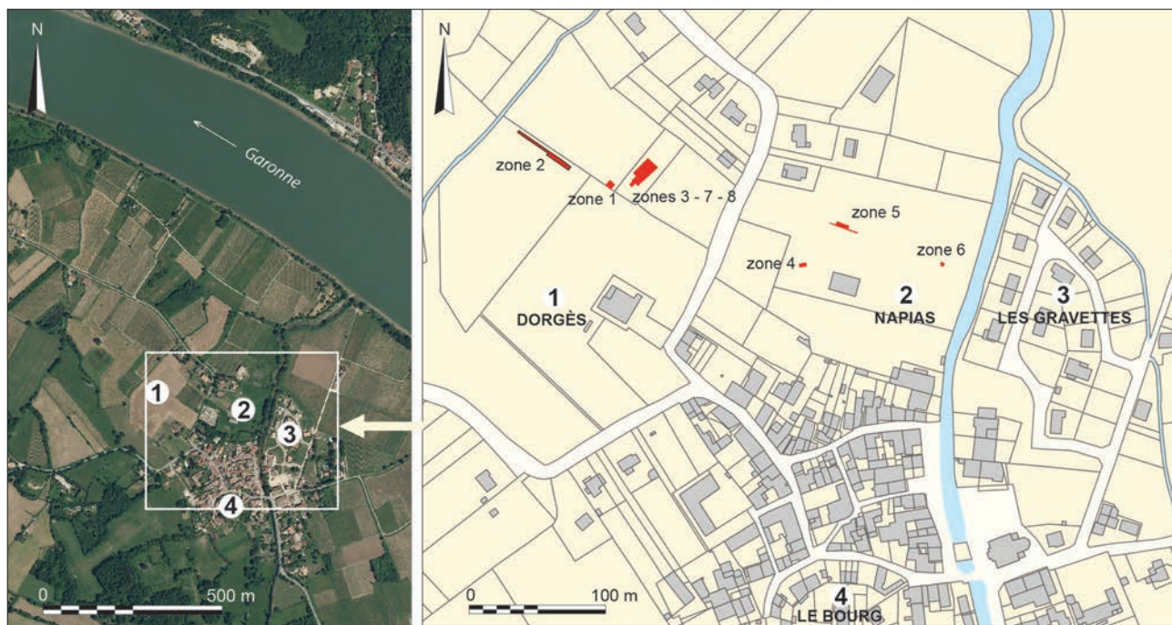
Fig. 2 – Localisation des zones de fouille du site de l'Isle-Saint-Georges (d'après Colin et al. 2015, fig. 2 et 4).