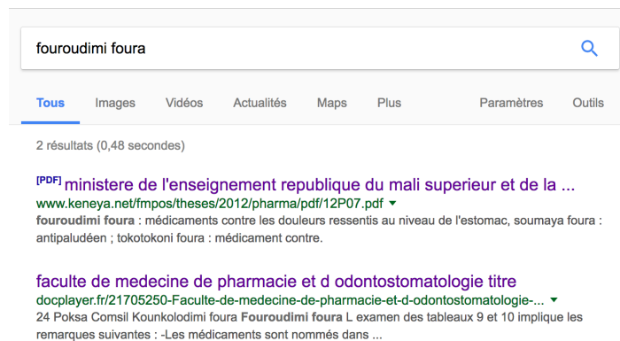
Figure 2 – Résultats obtenus pour la requête fouroudimi foura .

Pour ce cas nous choisissons comme requête fouroudimi foura ce qui signifie littéralement médicament contre le mal d'estomac .