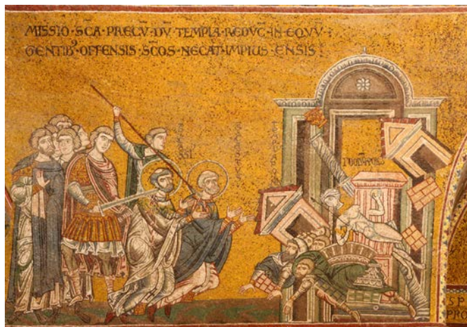
Fig. 205 – Le martyre des saints Cassius et Castus, cathédrale de Monreale, Sicile.