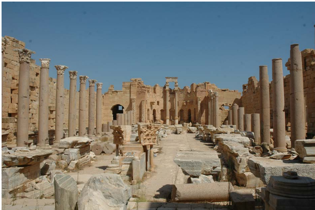
Fig. 209 – La basilique de Septime Sévère à Leptis Magna, Libye.

regard des données chronologiques. Les indications ne sont pas toujours très claires car il s'agit parfois de fouilles anciennes. Mais les travaux de Jacques Le Maho comme les fouilles d'Isabelle Cartron et Dominique Castex ont parfaitement démontré que, à Saint-Martin-de-Boscherville comme à Jau-Dignac-et-Loirac, le réinvestissement est tardif, probablement pas antérieur au VII e s. (Le Maho, 2004 ; Cartron-Castex, 2009 ; Cartron, 2009-2010). Il intervient donc après une probable période d'abandon ou de désaffectation de plusieurs siècles. Le cas de figure est sans doute le même à Civaux et à Roujan, et il faut vraisemblablement adjoindre à cette liste plusieurs édifices évoqués au cours du colloque consacré à « La fin des dieux » et qui sont évoqués dans ce dossier : l'église de Saint-Martin-au-Val à Chartres 315 , celle de Vernègues 316 ou bien encore l'ensemble de Portbail 317 .