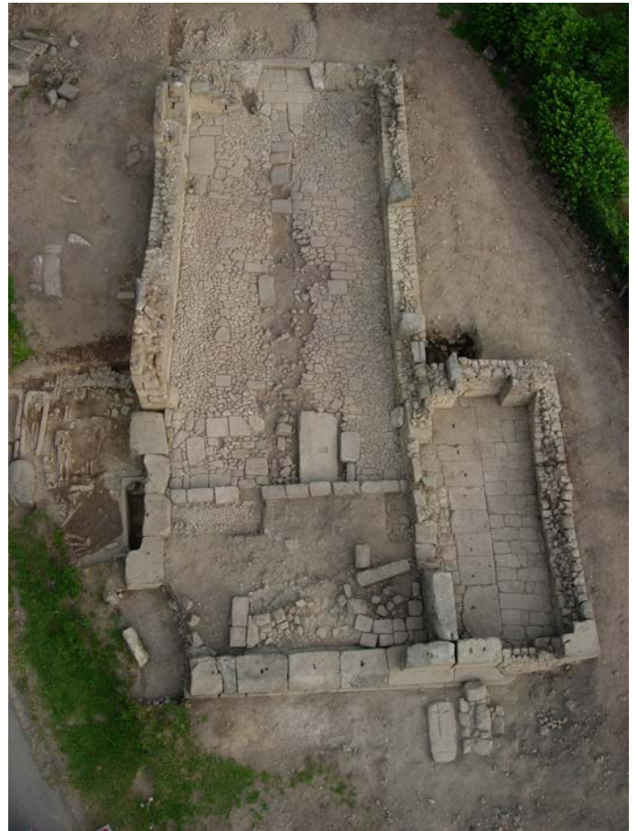
Fig. 208 – Vue générale de l'église Saint-Hilaire à Moutier-Rozeille, Creuse (cliché : J. Roger, INRAP).

sont en position de remploi, sans que leur lieu de provenance ne soit pour l'instant identifié (Adam, Jambon, 1996).