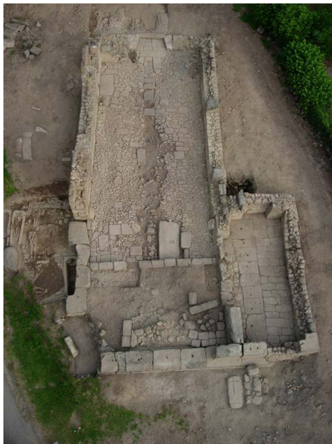
Fig. 208 – Vue générale de l'église Saint-Hilaire à Moutier-Rozeille, Creuse.

sont en position de remploi, sans que leur lieu de provenance ne soit pour l'instant identifié (Adam, Jambon, 1996).