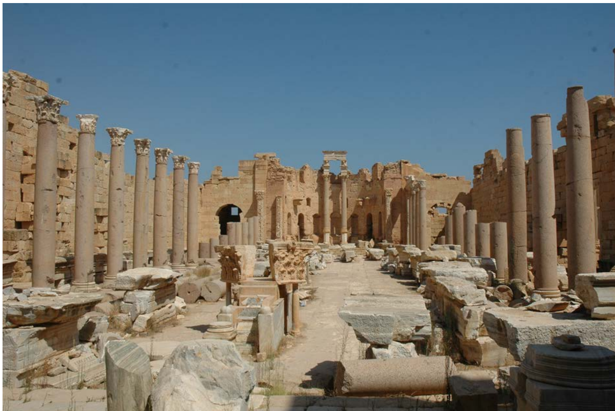
Fig. 209 – La basilique de Septime Sévère à Leptis Magna, Libye.