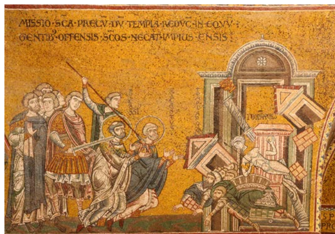
Fig. 205 – Le martyre des saints Cassius et Castus, cathédrale de Monreale, Sicile.