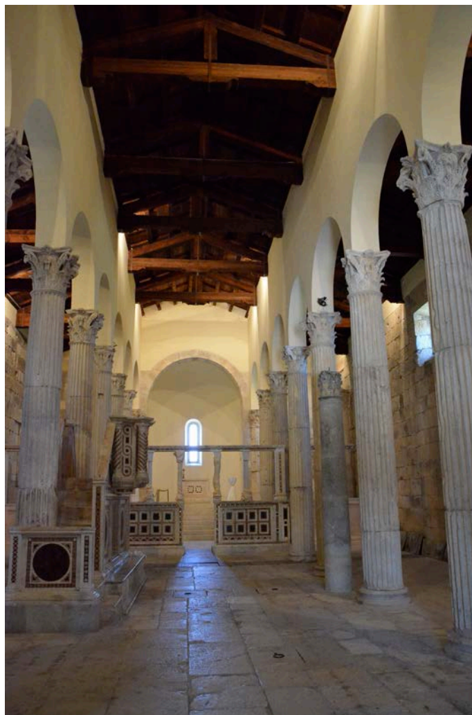
Fig. 206 – Intérieur de l'église Saint-Pierre à Alba Fucens, Abruzzes, Italie.

à travers d'exemples encore conservés. L'un des plus célèbres est très certainement le Panthéon de Rome, converti en église en 608 à l'initiative de Boniface IV (608-615). Longtemps considéré comme le plus ancien temple de la ville converti en église, il aurait pu avoir été précédé par quelques autres monuments selon des travaux récents 292 .