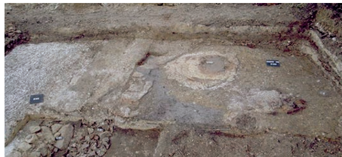
Fig. 120 – Le sol de l'habitat en « D ». On note les couches de craie sur un sol de terre battue, la sole en argile indurée et noircie au centre de la pièce ; au premier plan, en plus sombre, les fours arasés et, en noir, les couches de cendres et charbons de bois résiduels.