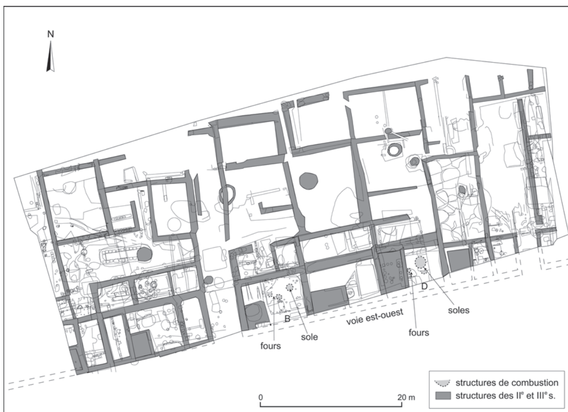
Fig. 118 – Plan de la fouille des Ateliers municipaux

(relevé 2000 : D. Vermeersch ; DAO : L. Costa, C. Kolhmayr, Service départemental d'archéologie du Val-d'Oise).