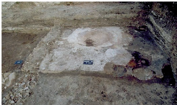
Fig. 119 – L'habitat en « D » : les couches de craie préparatoires à la mise en place des aménagements de foyer ; les cuvettes sans craie au premier plan correspondent à la mise en place des fours dolia.