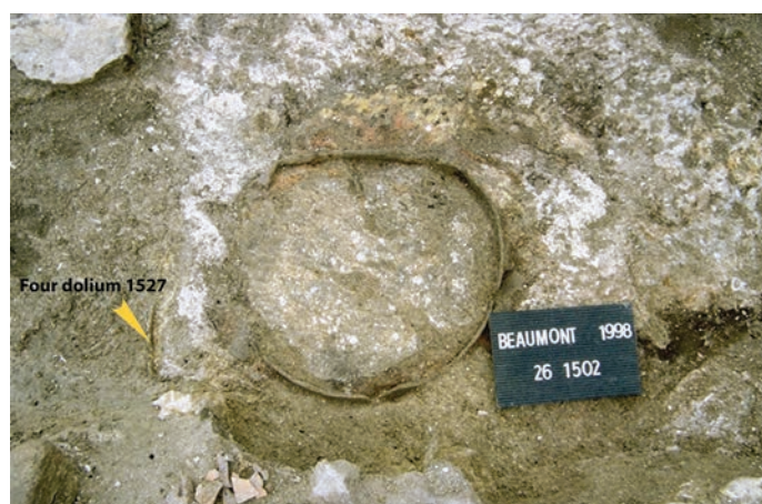
Fig. 122 – Le four dolium 1502 se révèle avec sa sole de craie ; à gauche, le rebord du four 1527.

La forte chaleur est certainement à l'origine de la destruction et du remplacement de la sole et du four. En effet, plusieurs réfections de foyers peuvent être parfois observées au même emplacement. Selon le degré et la durée de combustion, la zone supérieure de l'argile, et parfois de la craie, se trouve rubéfiée sur une profondeur et une surface variables. Ces réaménagements sont essentiellement séparés par de fins niveaux charbonneux provenant du curage ou de l'arasement du foyer et sont parfois relayés par des apports, crayeux, limoneux ou sableux. Il y a souvent plusieurs foyers mais fonctionnent-ils simultanément ou successivement ? Les fours sont remplacés et on en compte cinq en « D ».