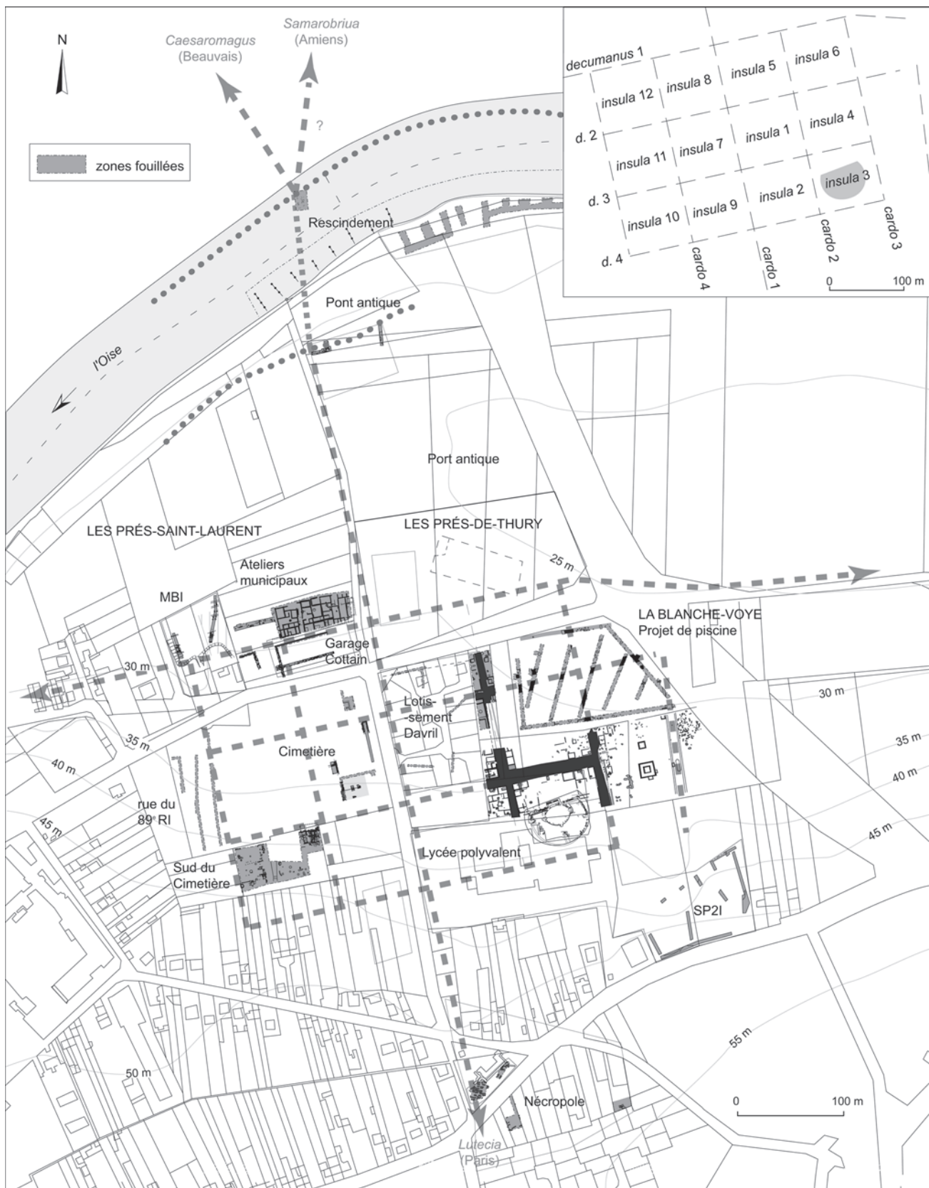
Fig. 117 – Plan général de l’agglomération antique de Beaumont-sur-Oise (relevé 2000 : F. Jobic et D. Vermeersch ; DAO : L. Costa, C. Kollmayer, Service départemental d’archéologie du Val-d’Oise ; relevé et DAO 2010 : A. Lefeuvre, Service départemental d’archéologie du Val-d’Oise).