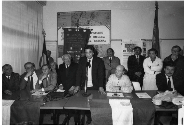
Svolta della Bolognina - 12 novembre 1989

italiens 10 . Réunir les 500.000 signatures requises ne fut qu'une formalité. Le référendum devait avoir lieu en juin 1985. Une autre échéance électorale attendait tout d'abord le PCI. Les élections européennes du 17 juin 1984 virent le triomphe du PCI, endeuillé par la disparition tragique de Berlinguer, victime d'un infarctus en plein meeting électoral le 7 juin (durant un discours retransmis en direct à la télévision 11 ), qui l'emporta le 11. Le Parti communiste obtint son maximum historique, devançant pour la première et dernière fois la DC (33,33% contre 32,96%) et écrasant le PSI de Craxi (11,21%). Il ne s'agissait pourtant, pour le défunt Berlinguer, que d'une victoire à la Pyrrhus. Le référendum sur la désindexation partielle de l'échelle mobile des salaires organisé les 9 et 10 juin 1985, marqua en effet sa défaite posthume. Une participation élevée (77,9%) ne permit cependant pas une mobilisation suffisante, les partisans de l'abrogation ne réunissant que 45,7% des suffrages contre 54,3% des partisans de la réforme.