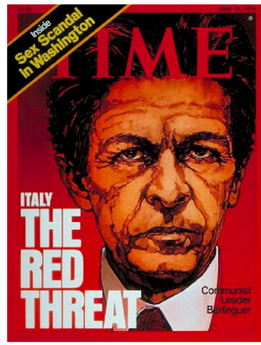
Couverture du magazine Time - Juin 1976