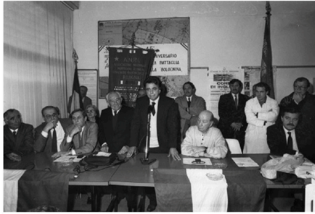
Svolta della Bolognina - 12 novembre 1989

italiens 10 . Réunir les 500.000 signatures requises ne fut qu'une formalité. Le référendum devait avoir lieu en juin 1985. Une autre échéance électorale attendait tout d'abord le PCI. Les élections européennes du 17 juin 1984 virent le triomphe du PCI, endeuillé par la disparition tragique de Berlinguer, victime d'un infarctus en plein meeting électoral le 7 juin (durant un discours retransmis en direct à la télévision 11 ), qui l'emporta le 11. Le Parti communiste obtint son maximum historique, devançant pour la première et dernière fois la DC (33,33% contre 32,96%) et écrasant le PSI de Craxi (11,21%). Il ne s'agissait pourtant, pour le défunt Berlinguer, que d'une victoire à la Pyrrhus. Le référendum sur la désindexation partielle de l'échelle mobile des salaires organisé les 9 et 10 juin 1985, marqua en effet sa défaite posthume. Une participation élevée (77,9%) ne permit cependant pas une mobilisation suffisante, les partisans de l'abrogation ne réunissant que 45,7% des suffrages contre 54,3% des partisans de la réforme.