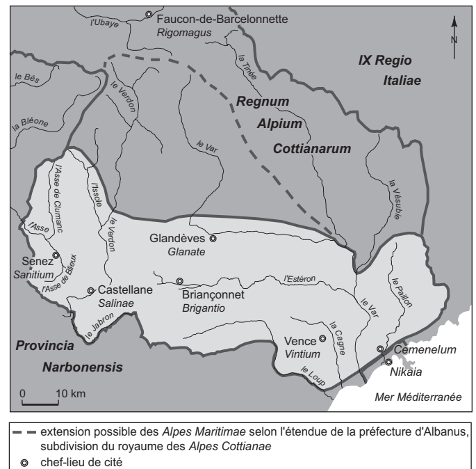
Fig. 1 – Les limites de la préfecture des Alpes Maritimae dans la première moitié du 1 er s. (DAO : S. Morabito).

l'Italie et plus particulièrement celles de la IX e région (sur le fleuve Var, frontière de l'Italie, voir Arnaud, 2000). Le classement par Ptolémée des cités littorales présentes à l'est du Var dans le chapitre consacré à l'Italie va dans ce sens (Ptolémée, Géographie , III, 1, 2). Nous pensons aux territoires compris entre Beaulieu-sur-Mer et la frontière italienne actuelle. Contrôlés en partie par Massalia avant la défaite des Phocéens en 49 face à César (au moins jusqu'à Monoecus /Monaco ?), ces territoires ont été englobés sous Auguste non dans la préfecture des Alpes Maritimes mais dans le municipes d' Albintimilium /Vintimille 28 . A contrario du découpage adopté par T. Mommsen dans le V e volume