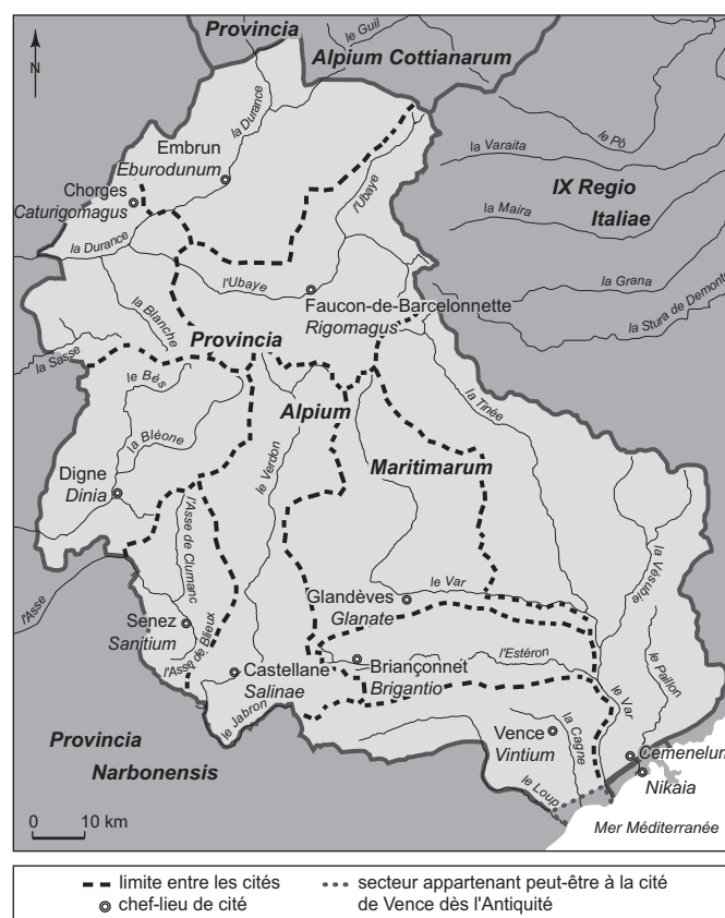
Fig. 3 – Les limites de la province des Alpes Maritimae à la fin du II e s. (DAO : S. Morabito).

responsable du culte impérial dans le courant du II e s. 48 . Le rapprochement entre ces inscriptions laisse supposer un transfert entre la fin du I er s. et la seconde moitié du II e s.