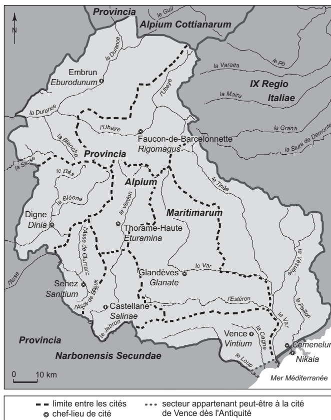
Fig. 4 – Les limites de la province des Alpes Maritimae durant l'Antiquité tardive (DAO : S. Morabito).

autonome à cette époque ( CIL , XII, 78). La perte d'autonomie de Caturigomagus est sans doute à mettre en relation avec le changement de métropole provinciale. Le déplacement du centre principal de la province de Cemenelum , au sud, à Eburodunum , au nord, a pu amener le pouvoir romain à rassembler les civitates de Chorges et d'Embrun afin de créer une cité digne de devenir la métropole de la province, avec un territoire réunissant l'ensemble des terres marquant la frontière nord de la province des Alpes Maritimes 80 . Cette hypothèse explique le fait que Caturigomagus n'aurait pas été élevée durant l'Antiquité tardive au rang d'évêché mais intégrée dans les limites du diocèse d'Embrun 81 ,