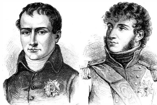
Joseph Bonaparte & Joachim Murat

Au regard, plus précisément, de la conservation du patrimoine religieux, l'Histoire tourmentée de l'Italie explique une réglementation complexe, tranchant avec la relative simplicité de la législation française. La loi de séparation des Églises et de l'État 18 confirma l'appropriation publique pour les édifices construits et affectés au culte avant 1905, les édifices érigés postérieurement appartenant à leurs financeurs. Si la loi de 1905 se situe, en matière patrimoniale, dans la continuité du droit antérieur 19 , le principe de laïcité qu'elle arrime à l'histoire de la République mit un terme au service public culturel, l'État ne reconnaissant ni ne subventionnant plus aucun culte 20 . Ce ne sont donc plus les fabriques 21 qui ont la charge de l'entretien et de la conservation des édifices, mais le service des Monuments historiques pour les édifices classés. La loi du 17 avril 1906 et le décret du 4 juillet 1912 ont confié la charge des 87 cathédrales au secrétariat d'État aux Beaux-arts, devenu ministère de la Culture et de la Communication. Cette propriété s'étend à