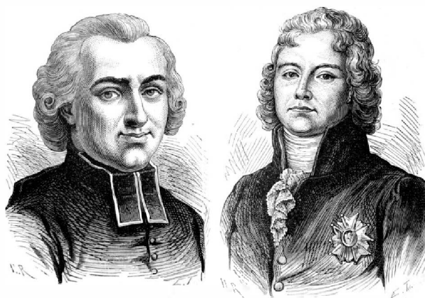
Henri Grégoire & Talleyrand Illustrations parues dans l'Album du centenaire - 1889

L'Histoire s'avère parfois facétieuse. C'est en effet à deux ecclésiastiques français aux parcours atypiques, puisés à la Révolution, l'un par pragmatisme, Talleyrand, l'autre par conviction, Henri Grégoire, dit l'abbé Grégoire, qu'on doit les linéaments d'une protection du patrimoine national français, en même temps que commençait de se tracer une séparation de destins entre l'Église et l'État. C'est également dans le sillage de l'Histoire française qu'une partie de la péninsule italienne, happée par les occupations révolutionnaire et impériale, commença à mûrir l'idée de l'unité, en même temps qu'elle sécularisait une partie des biens de l'Église. L'Histoire française et italienne prit cependant un tour différent, la France achevant définitivement sa mue républicaine dans les années 1870, alors que l'Italie, durant la même période, inaugurerait progressivement son unité, sous les auspices des Savoie, étendant leur royaume à toute la péninsule. Si l'anticléricalisme prégnant en France depuis la Révolution, et en Italie surtout à partir du Risorgimento , sont des caractéristiques communes aux deux pays, les conséquences qu'ils en tirèrent en matière patrimoniale