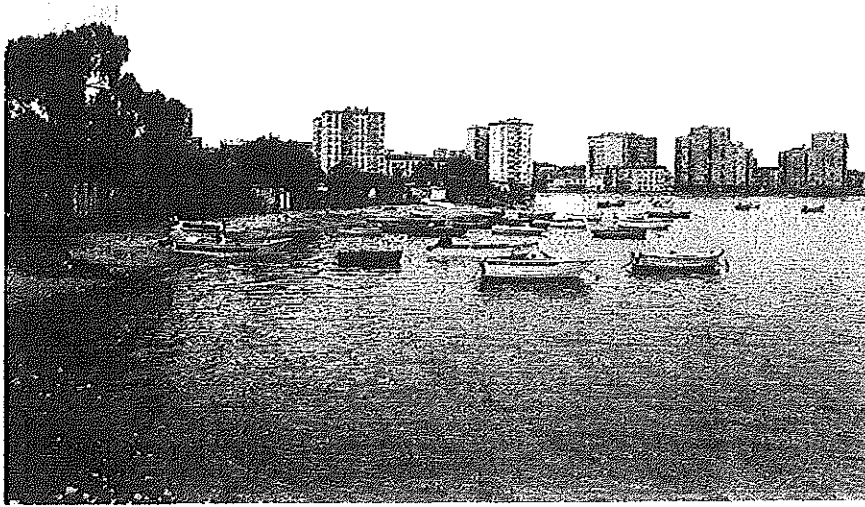
Paysage de choc temporel, village de Barreiro, Portugal, 1999.