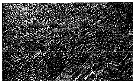
Pompéi et Pripiat

Mais on ne peut penser à Pripiat sans évoquer également la ville de la catastrophe moderne dont nous avons déjà parlé : Lisbonne. La question du XVIIIème était de savoir comment concevoir le mal une fois privés de références divines. Aujourd'hui, après l'irruption de formes nouvelles et, jusqu'il y a peu, impensables du mal (les camps d'extermination, Hiroshima, et désormais Tchernobyl), n'est-on pas en face de la même difficulté ? Mais notre seule expérience contemporaine n'est-elle pas justement celle de l'effondrement de l'expérience et de la mémoire ? Si Tchernobyl a bien ébranlé nos dernières certitudes quant aux promesses de la technique, Pripiat est désormais le lieu de cet effondrement.