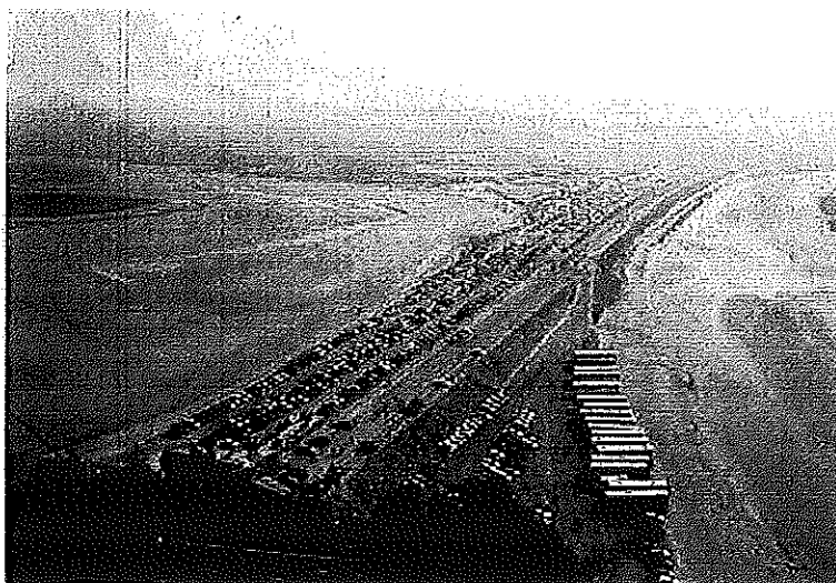
Le Mont-saint-Michel à l'heure du tourisme mondialisé.