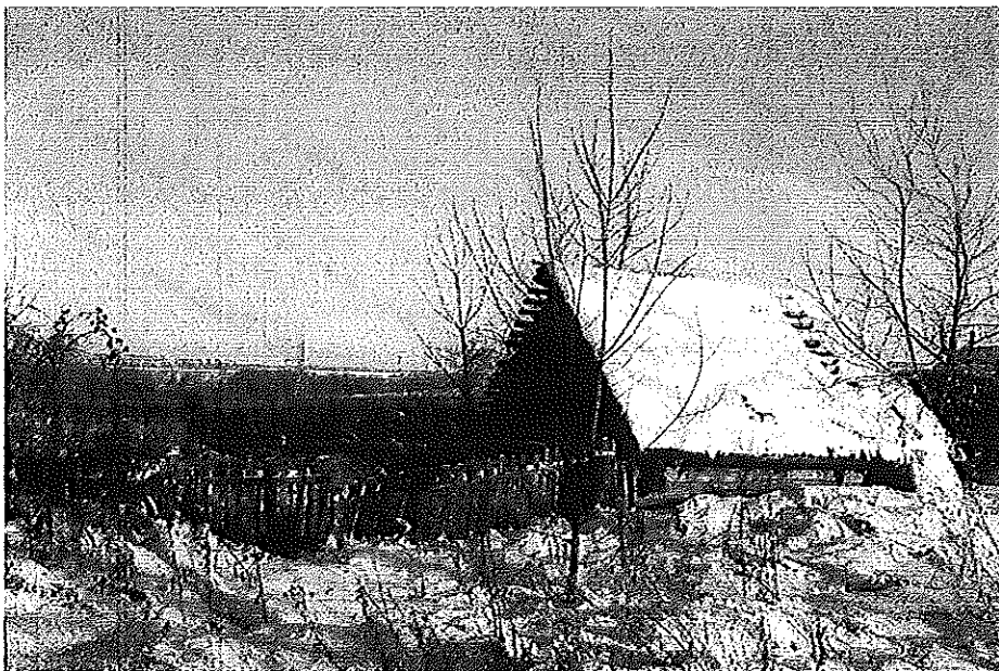
Paysage de catastrophe, zone contaminée par l'accident de Tchernobyl, région de Kastiokovitchi, Belarus, 1997.