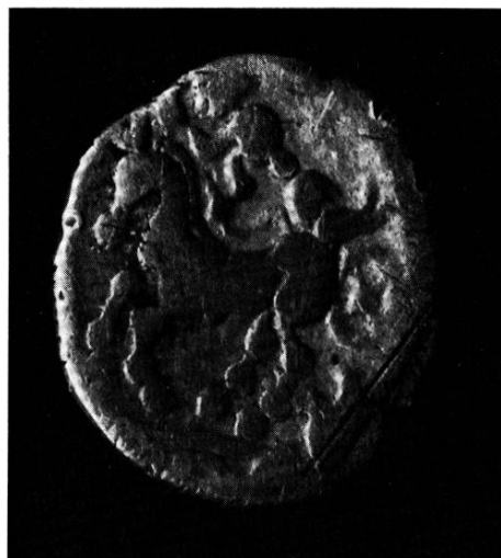
2 Le quart de statère d'Aigremont, Gard, droit et revers (grossi 4 fois).

revers, ordinairement figuré à droite, le bige originel est ici remplacé par un seul cheval, aux pattes bouletées, le char n'est signalé que par une roue et le degré de stylisation est très avancé ; la légende n'apparaît pas.