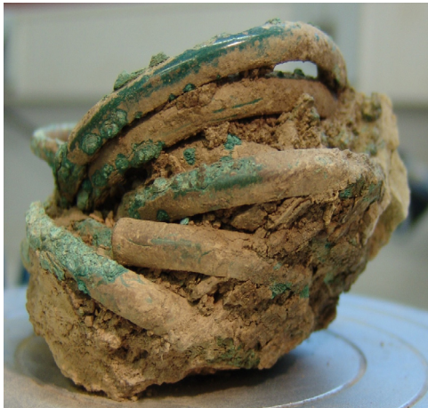
Fig. 3 : Empilement des bracelets dans la partie basse du dépôt de Saint-Lumine-de-Clisson, prélevé en motte et fouillé en laboratoire. Photographie M. Nordez.

indiqué plus haut, les fragments de bracelets à tige rubanée étaient placés à l'intérieur de l'espace vide créé par l'empilement des bracelets. Bien que la position d'origine des différents objets à l'intérieur du dépôt ne puisse pas être reconstituée précisément, plusieurs observations vont dans le sens d'une organisation mûrement réfléchie. Les haches complètes étaient placées en haut du dépôt, face contre face. La pointe de lance était en position verticale, pointe vers le haut, à côté des bracelets. Les douze bracelets de même type et de mêmes dimensions étaient empilés les uns au-dessus des autres dans le fond du vase. Enfin, les fragments de bracelets à tige rubanée étaient placés les uns sur les autres, à l'intérieur du vide laissé par l'empilement des bracelets. D'un point de vue spatial, les trois catégories fonctionnelles semblent bien avoir été séparées : l'outillage en haut, l'unique pièce d'armement à côté des bracelets, les parures annulaires empilés les uns sur les autres dans la partie basse de la fosse.